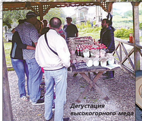
Дегустация высокогорного меда

Как потом оказалось, еда в Абхазии дорогая, но практически везде качественная. Даже в совдеповской столовой можно вкусно поесть (и не дорого).