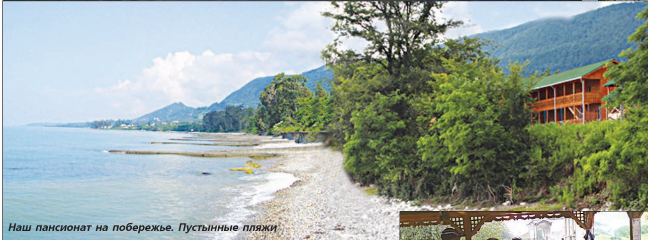
Наш пансионат на побережье. Пустынные пляжи