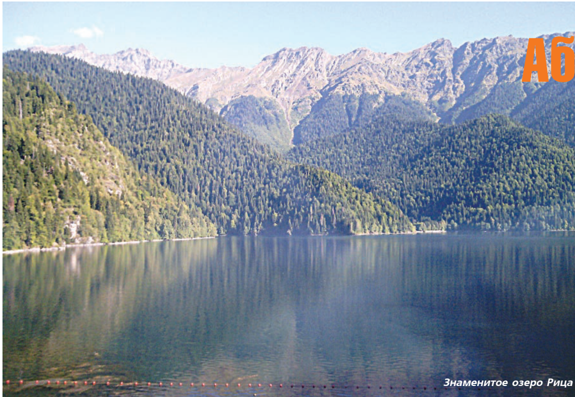
Знаменитое озеро Рица