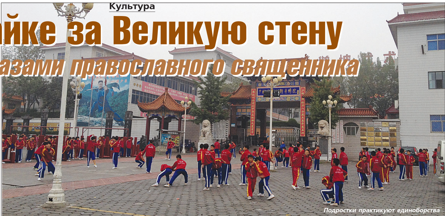
Подростки практикуют единоборства

Поездки запоминаются сложностями. Если все дни одинаковые и ничего не происходит - это неинтересно. Первый запоминающийся день был перед въездом в Китай - мы поднялись с одной на четыре тысячи метров над уровнем моря при подъезде к границе. Первый раз мы ощутили, что такое "горная болезнь".