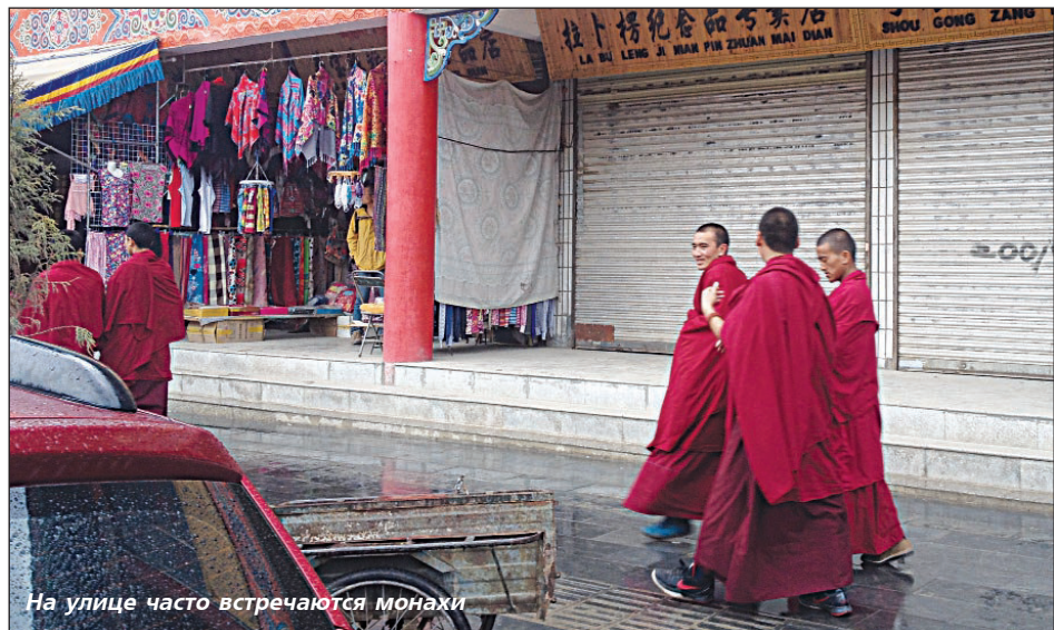
На улице часто встречаются монахи