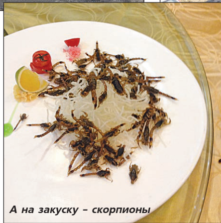
А на закуску - скорпионы

Много различных впечатлений. Китайцы творят чудеса с дорогами: посреди ку-