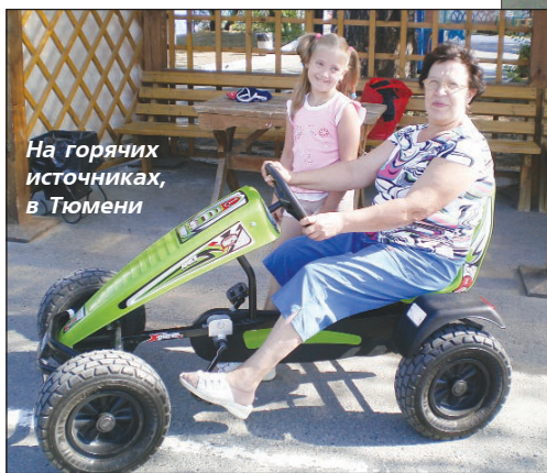
На горячих источниках, в Тюмени