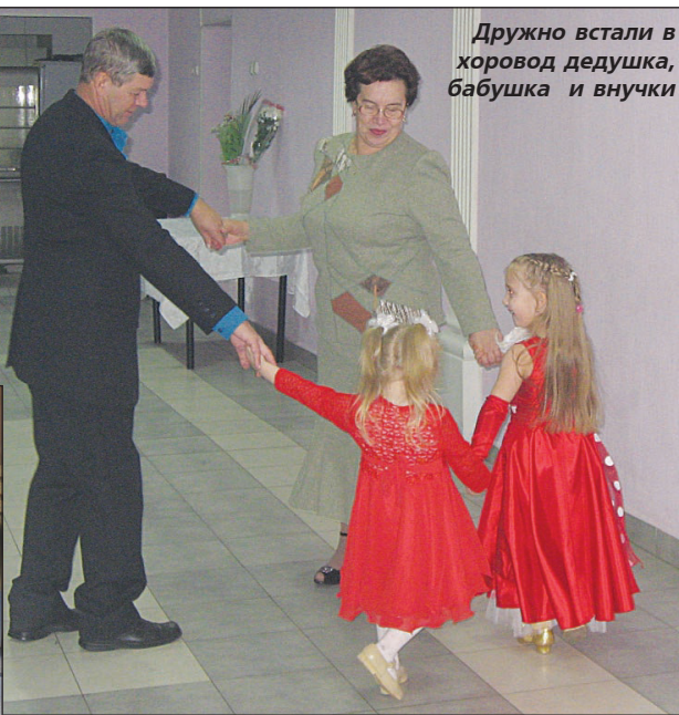
Дружно встали в хоровод бабушка, бабушка и внуки