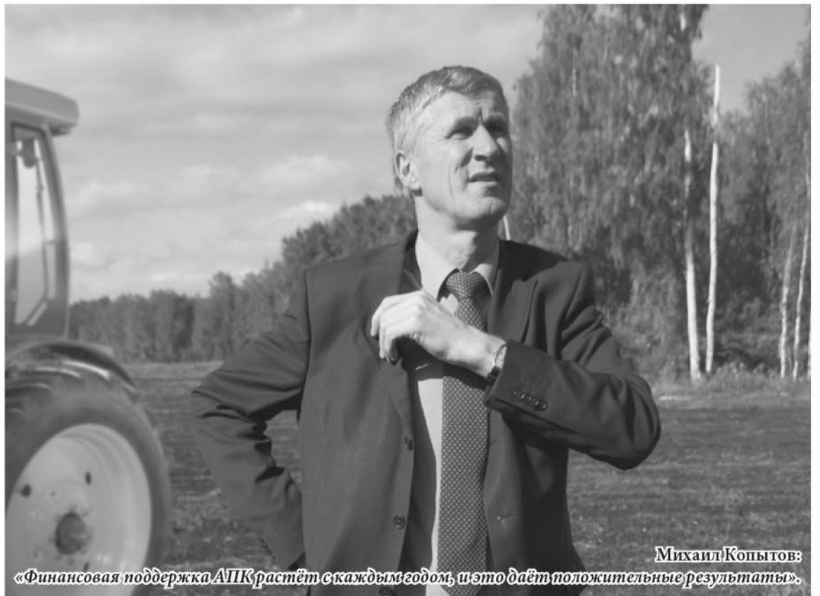
«Финансовая поддержка АПК растёт с каждым годом, и это даёт положительные результаты».

Денис Паслер, председатель правительства Свердловской области: – На 2015 год правительство области сформировало бюджет так, чтобы в полном объёме сохранить все меры поддержки сельхозпредприятий.