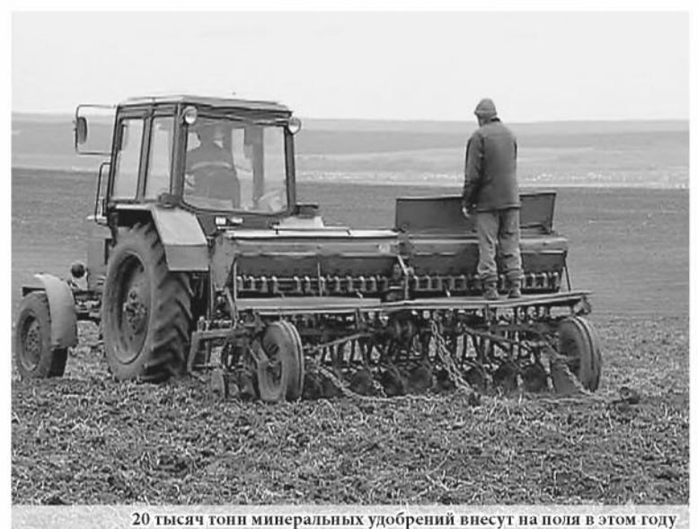
20 тысяч тонн минеральных удобрений вносят на поля в этом году

По последним данным министерства сельского хозяйства РФ, в южных районах страны посевная началась на 2 недели раньше. Мы не исключаем, что благодаря хорошей погоде и мы сможем выйти в поля раньше. А пока в рабочем порядке готовимся к кампании».