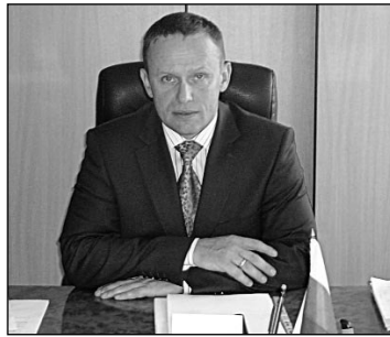
(Продолжение. Начало в "КР" № 13) Образование

Отметим, что социальная поддержка ветеранов в Свердловской области находится на личном контроле у губернатора Евгения Куйвашева, и является одним из приоритетов в реализации социальной политики региона.