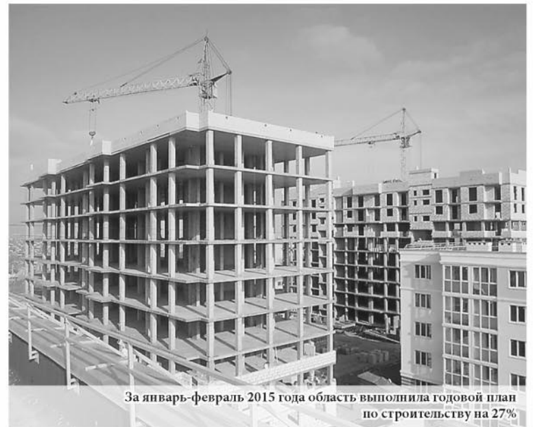
За январь-февраль 2015 года область выполнила годовой план по строительству на 27%

годового плана. Всего к концу года мы планируем построить 2,1 миллиона квадратных метров жилья. Но важно понимать, что сейчас сдаётся то, что начало возводиться в 2013 году – начале 2014 года. Поэтому сегодня мы должны делать задел на будущие периоды. Важно, чтобы застройщики не только работали над завершением имеющихся объектов, но и начинали новые проекты, которые будут сдаваться в 2016-2017 годах».