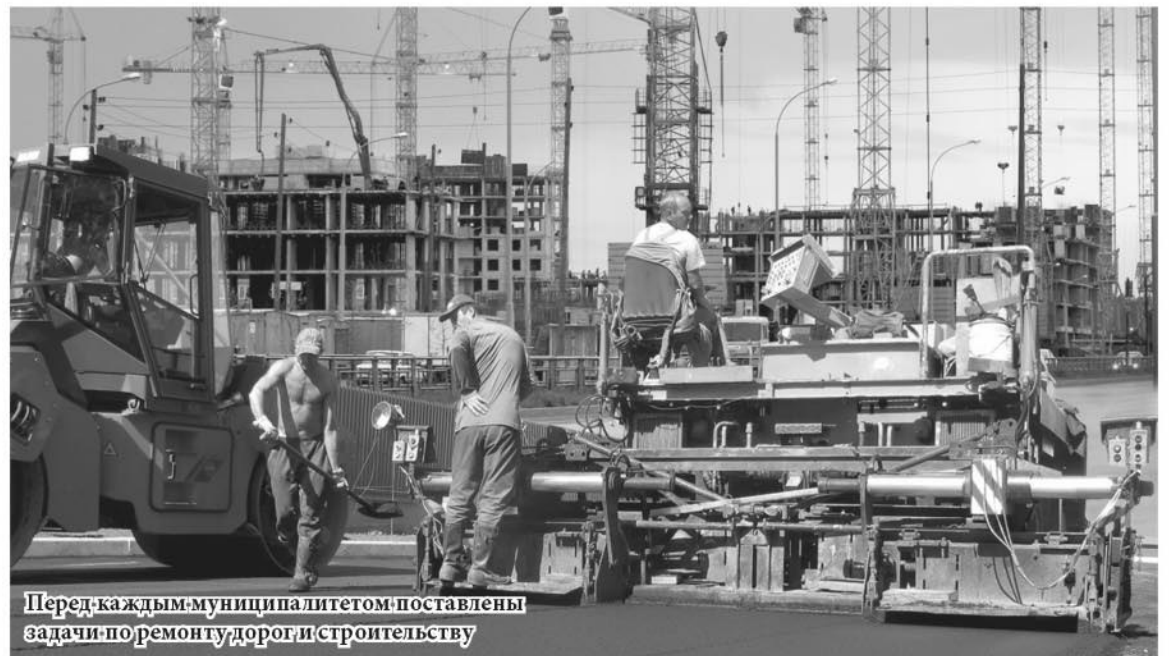
Перед каждым муниципалитетом поставлены задачи по ремонту дорог и строительству

«Это значит, что снижение доходного прогноза территорий при балансировке будет скомпенсировано из областного бюджета субсидиями и дотациями, – отметила министр финансов области Галина Кулаченко. – Кроме того, не совсем корректно сравнивать общую сумму заявленной потребности муниципалитетов с итоговой. Ведь еще на старте согласительных процедур мы договорились о том, что в сегодняшней экономической ситуации должны быть выделены и обоснованы самые основные проблемы, требующие дополнительного финансирования».