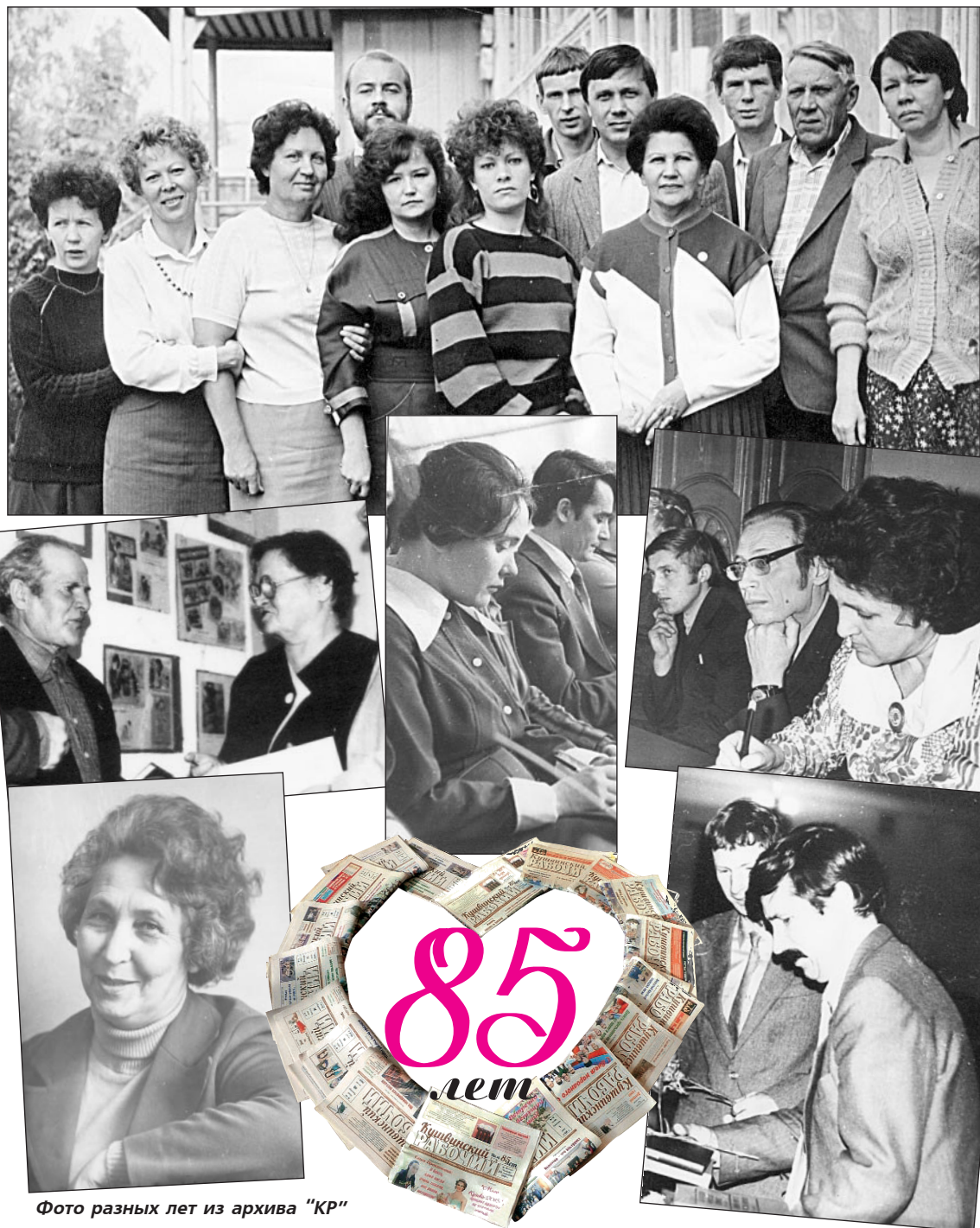
Фото разных лет из архива "КР"