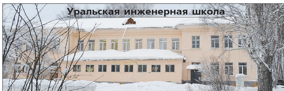
Уральская инженерная школа