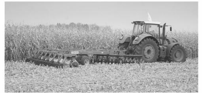
В 2015 году было отмежевано 12,6 тыс. га, в прошлом году – почти 30 тысяч, на будущий год стоит задача ввести в оборот 25 тыс. га.