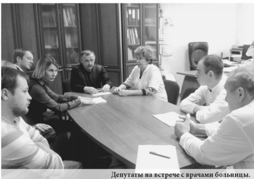
Депутаты на встрече с врачами больницы.

По словам депутата, больница в Бисерти является одной из