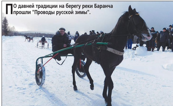
По давней традиции на берегу реки Баранча прошли "Проводы русской зимы".