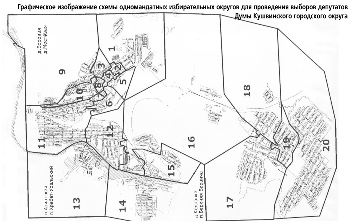
СХЕМА одномандатных избирательных округов для проведения выборов депутатов Думы Кушвинского городского округа

Численность избирателей на 01.07.2015 г. - 36509 чел.