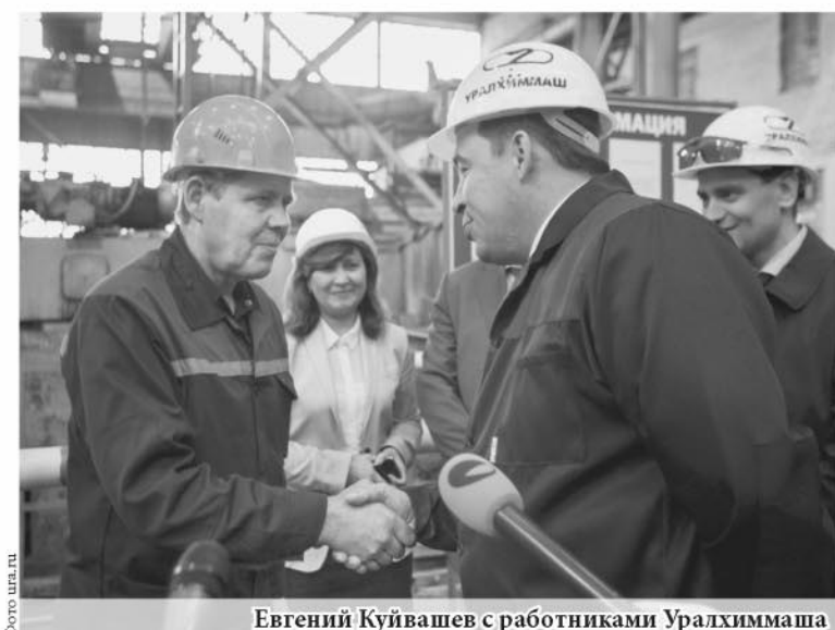
Евгений Куйвашев с работниками Уралхиммаша

С начала 2016 года индекс промышленного производства в Свердловской области вырос на 23,6 процента. Эти свежие статистические данные вновь подтверждают верность тезиса губернатора Евгения Куйвашева о том, что обрабатывающие производства являются локомотивом промышленности региона и основой роста экономики.