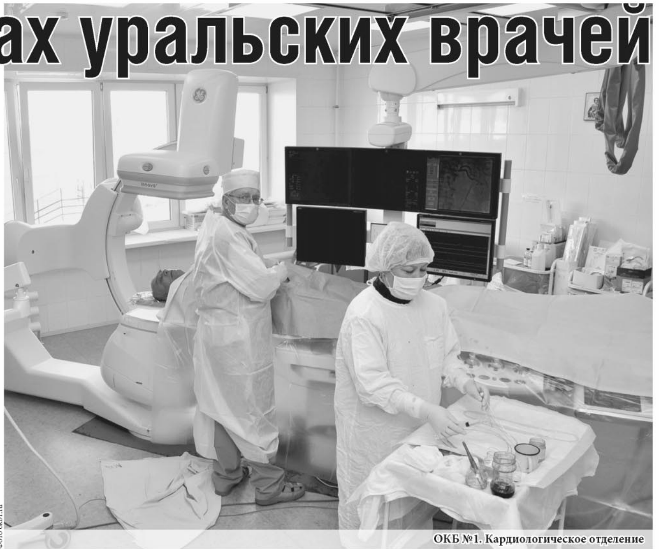
ОКБ №1. Кардиологическое отделение

Мы, члены Совета Медицинской Палаты Свердловской области, не можем оставаться безучастными к тому, что отдельные люди в угоду собственным амбициям и экономическим интересам пытаются использовать неподустимые методы для того, чтобы создать вокруг медиков и их работы исключительно негативную информационную обстановку...».