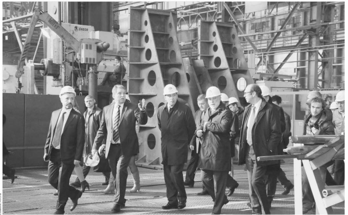
Уральский турбинный завод в 2016 году планирует запуск цеха ремонтно-восстановительного производства деталей горячего тракта энергетических турбин.

В Свердловской области есть финансовая, промышленная, интеллектуальная и кадровая база, необ-