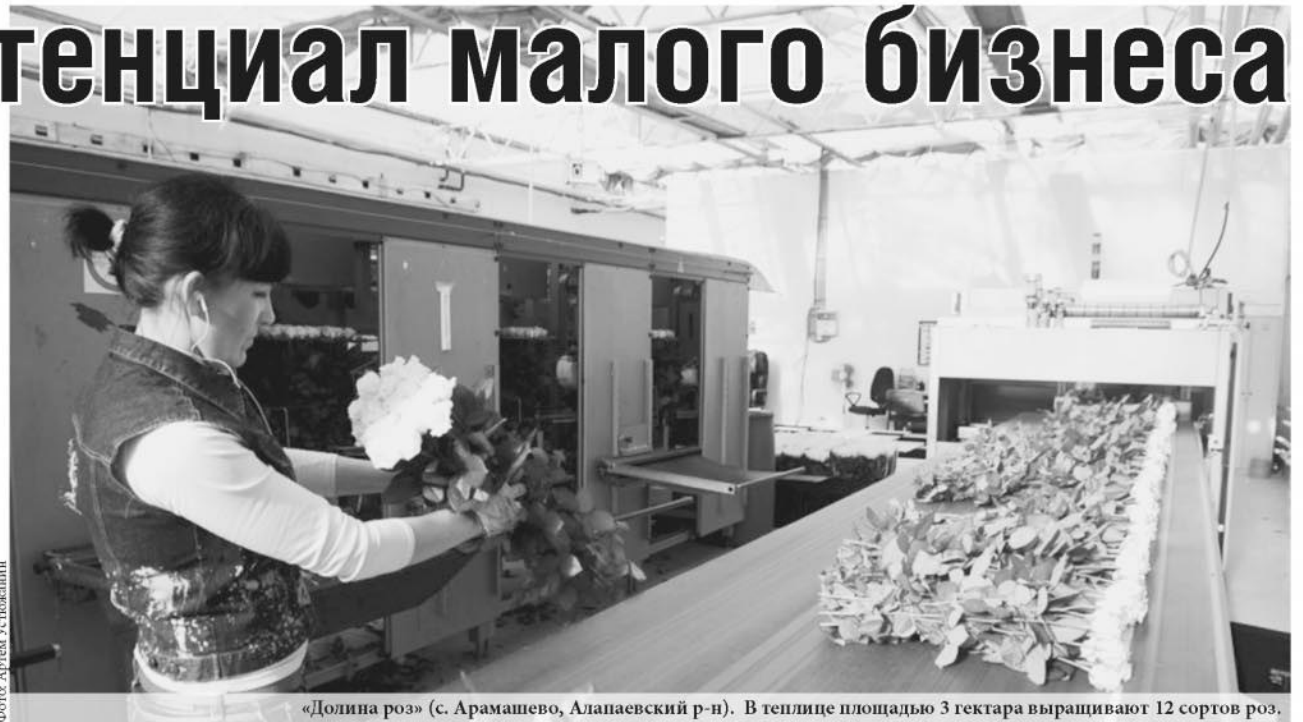
«Долина роз» (с. Арамашево, Алапаевский р-н). В теплице площадью 3 гектара выращивают 12 сортов роз.

Малый и средний бизнес отметил в конце мая свой профессиональный праздник – День предпринимателя. По мнению губернатора Евгения Куйвашева, деловая инициатива в Свердловской области развивается высокими темпами. В рамках поддержки малого и среднего предпринимательства проводятся обучающие программы, начинающим предоставляются гранты для реализации бизнес-проектов, тем, кто занят в реальном секторе экономики, выделяются субсидии на модернизацию оборудования. Всё это вносит весомый вклад в решение социально-экономических задач региона, улучшение делового климата, повышение устойчивости экономики.