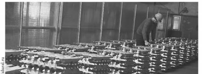
Завод алюминиевых сплавов (п. Монетный). Алюминиевые чушки поставляются на мировые концерны в Японию, Германию, США и другие страны.

...Под таким названием в рамках празднования Дня российского предпринимательства в Доме журналистов открылась фотовыставка уральских предприятий.