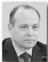
Сергей Пересторонин, министр промышленности и науки Свердловской области:

В рамках этой госпрограммы развития промышленности предприятиям выделяются специальные субсидии. Создаются новые для региона направления промышленности – например, авиационное».