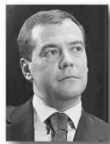
Дмитрий Медведев, председатель Правительства РФ:

По мнению участников, прошедший форум имеет огромное значение – здесь состоялся откровенный разговор между властью и бизнесом. По словам Дмитрия Медведева, ещё недавно сложно было представить, чтобы власть и бизнес так легко находили общий язык и так доверяли друг другу. «Мы сумели выстроить диалог, воспринимаем противоположную сторону как союзника, а не конкурента. Это очень важно, поскольку только так можно добиться хороших результатов», – сказал Дмитрий Медведев.