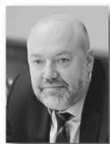
Павел Крашенинников, председатель комитета Госдумы РФ по гражданскому, уголовному, арбитражному и процессуальному законодательству:

Государственные программы поддержки, направленные на сокращение налоговых платежей или даже их временную отмену, снижение административных барьеров, информационную поддержку, создание особых экономических зон и другие меры приносят свои плоды. Предпринимателей становится все больше, все больше людей выбирают бизнес в качестве основного занятия. Это можно, без сомнения, назвать позитивной тенденцией в развитии отечественной экономики».