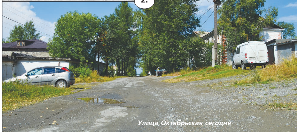
Улица Октябрьская сегодня