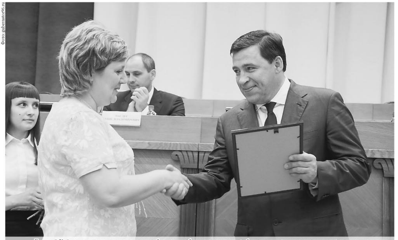
Евгений Куйвашев отметил, что в регионе обязательно будет продолжена работа по материальному стимулированию педагогов. Кроме того, отдельное внимание будет уделено повышению квалификации и решению жилищных проблем учителей.

«Одной из ключевых тем на областном педсовете стал вопрос снижения бумажной отчётности в наших школах. У нас есть поручение губернатора по широкому обсуждению этой проблемы с учительским сообществом. Евгений Куйвашев совершенно верно указывает на то, что в школах нам необходимо больше доверия нашим учителям, и меньше бумажной волокиты, бюрократии. Такие же установки дал председатель Правительства России Дмитрий Медведев».