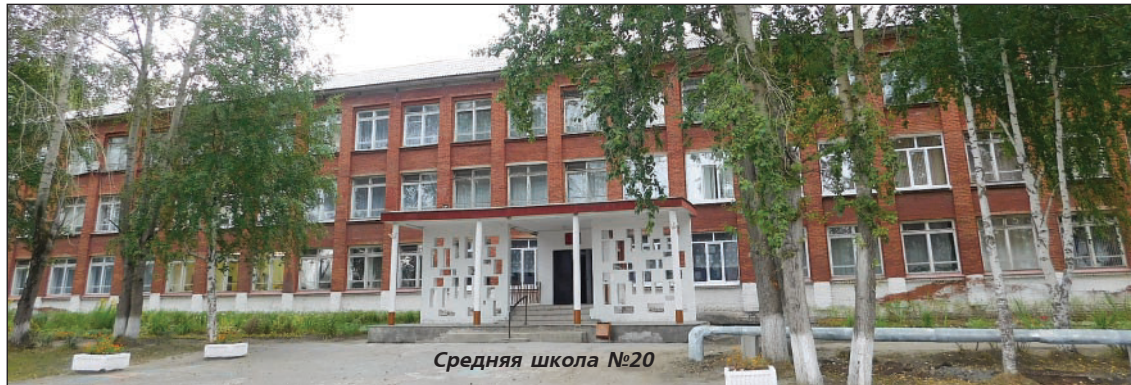
Средняя школа №20