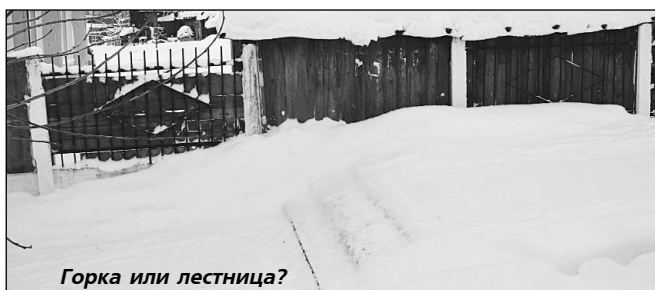
Горка или лестница?

В январе знака не стало, осталась только труба-основание. Сотрудники ДПС продолжают штрафовать пешеходов на этом отрезке тротуара.