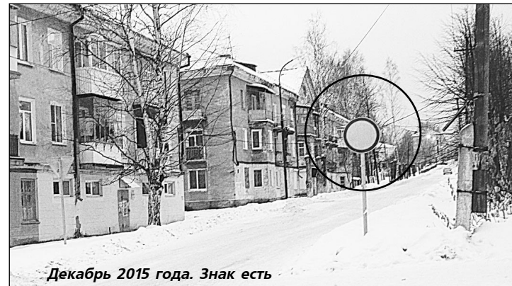
Декабрь 2015 года. Знак есть