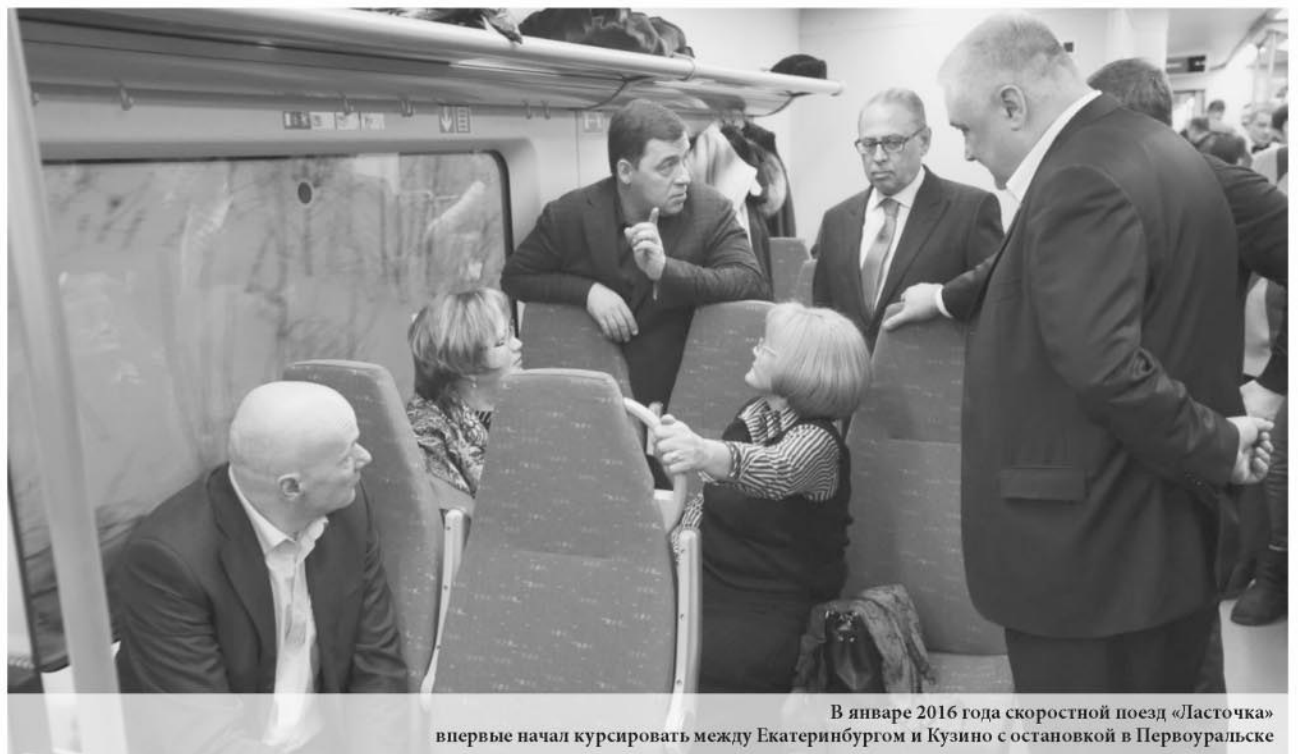
В январе 2016 года скоростной поезд «Ласточка» впервые начал курсировать между Екатеринбургом и Кузино с остановкой в Первоуральске