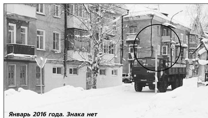
Январь 2016 года. Знака нет