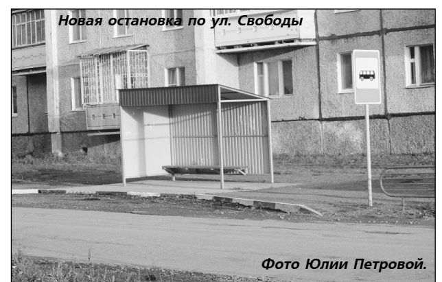
Новая остановка по ул. Свободы

- Уже подписаны все разрешительные документы, есть решение комиссии по транспортному сообщению. Пока по этой улице будет ходить маршрут №3 "пос. Восток - пос. Дачный". Дело за перевозчиком, он должен внести изменения в паспорт маршрута, после этого выйдет постановление главы КГО об изменении автобусного маршрута и автобусы пойдут.