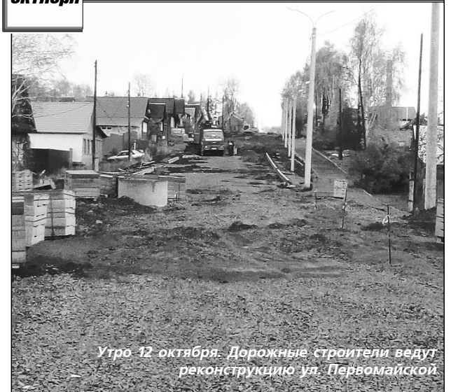
Утро 12 октября. Дорожные строители ведут реконструкцию ул. Первомайской.

УВАЖАЕМЫЕ ветераны и работники предприятий дорожного хозяйства Горнозаводского управленческого округа! Примите поздравления с вашим профессиональным праздником!