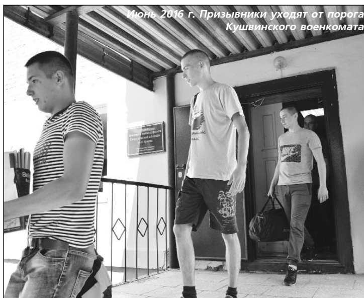
Июнь 2016 г. Призывники уходят от порога Кушвинского военкомата