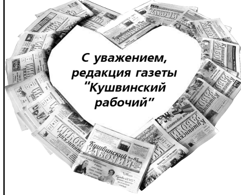
С уважением, редакция газеты "Кушвинский рабочий"

Принимаются коллективные заявки на подписку в редакции от предприятий, организаций, жителей.