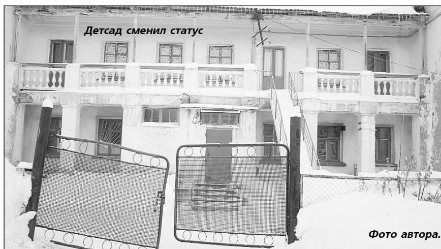
Детсад сменил статус