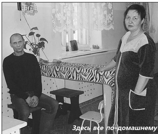
Здесь все по-домашнему