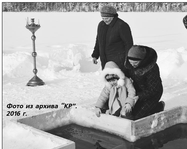
2016 г.

С 24 января движение автобуса будет осуществляться по расписанию.