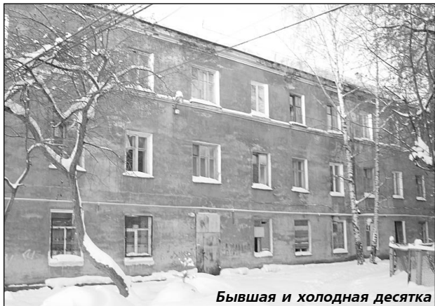
Бывшая и холодная десятка