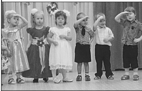
Родительский комитет младшей группы

По мнению родителей, такие мероприятия объединяют их с детьми и педагогами, ведь можно пообщаться в тесном кругу, повеселиться и обсудить планы на будущее.