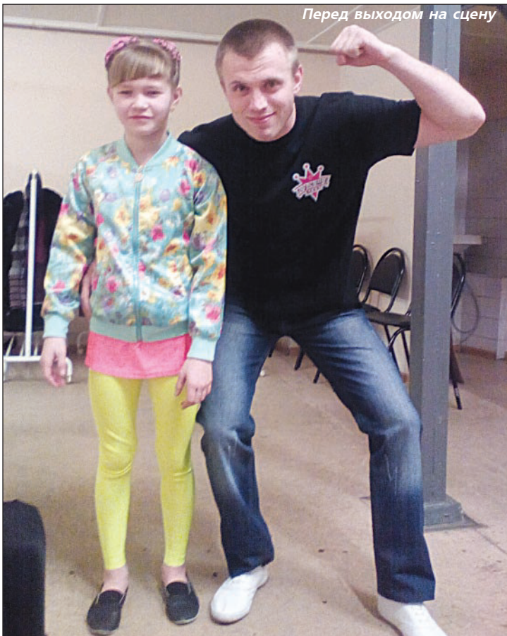
Перед выходом на сцену

12-летняя баранчинская школьница выступила на Первом канале в телешоу "Лучше всех!"