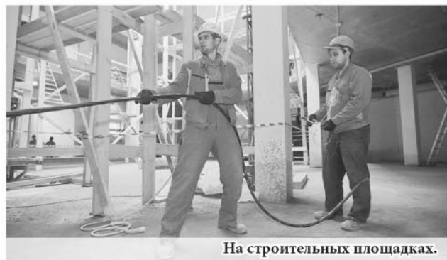
На строительных площадках.

Ещё одно направление работы правительства области – расселение ветхого и аварийного жилья. С 2013 года расселено более 12 тыс. человек. Ликвидировано 196 тыс. м 2 аварийного жилья. До 1 сентября 2017 года весь аварийный жилой фонд, признанный таковым по состоянию на 1 января 2012 года и входящий в реестр, должен быть полностью расселён.