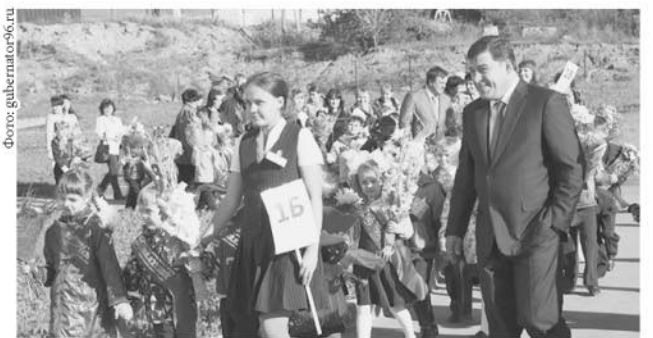
К 2025 году все школьники должны учиться в одну смену

В области начался перевод школ на односменный режим обучения. В 2016 году создано 3 700 новых учебных мест, введена в строй первая очередь самой крупной и современной школы области в районе «Академический» (г. Екатеринбург).