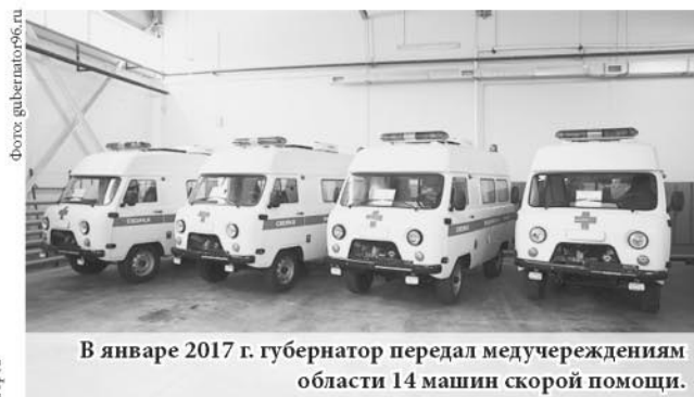
В январе 2017 г. губернатор передал медучреждениям области 14 машин скорой помощи.

В ближайшие годы предстоит решить проблему очередей в поликлиниках, обеспечить каждую больницу достаточным количеством «узких» специалистов. По словам губернатора, также нуж-