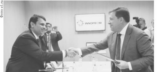
На ИННОПРОМе-2016 было подписано 87 соглашений на общую сумму 4,5 млрд. рублей

ские связи, упрочить позиции международного центра. Выставка ИННОПРОМ вошла в календарь крупнейших выставочных проектов мира, обрела статус главной промышленной выставки России. В 2015 году официальным партнёром выставки был Китай, в 2016 – Индия. Официальным партнёром ИННОПРОМа в 2017 году будет Япония.