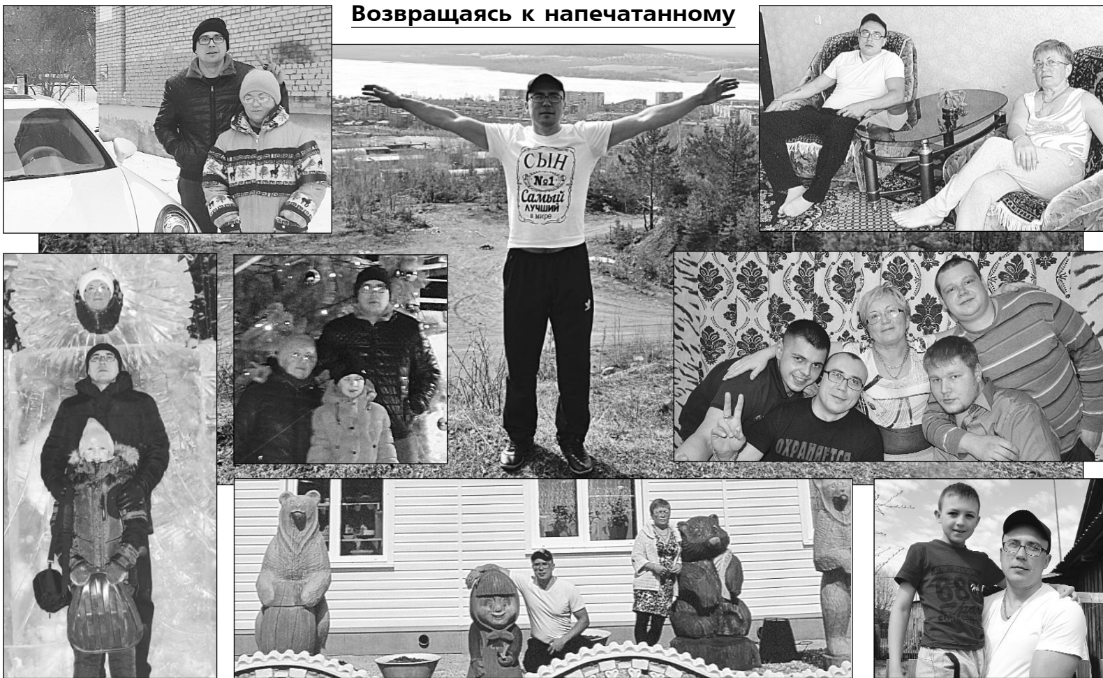
Возвращаясь к напечатанному