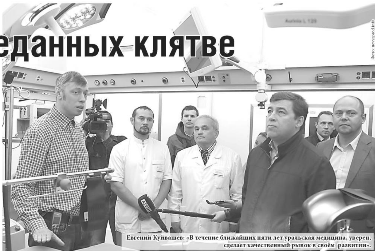
Евгений Куйвашев: «В течение ближайших пяти лет уральская медицина, уверен, сделает качественный рывок в своём развитии».

На прошедшей неделе прошли торжественные мероприятия, посвящённые Дню медицинского работника. По словам главы региона Евгения Куйвашева, власти всех уровней внимательно относятся к проблемам отрасли и делают всё необходимое, чтобы создать условия для их решения. Так, Свердловская область стала одним из первых регионов в стране, где был принят закон «Об охране здоровья граждан в Свердловской области». В нём были прописаны понятия: здоровье, медицинская помощь, основные принципы охраны здоровья и другие. А также установлены меры соцподдержки работников сферы здравоохранения.