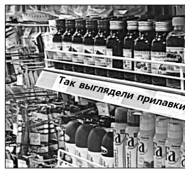
Так выглядели прилавки магазинов в прошлом году

ции, прокуратуры, администрации КГО, ЦГБ 18 января озвучили результаты мероприятий по реализации постановления главного санитарного врача РФ.