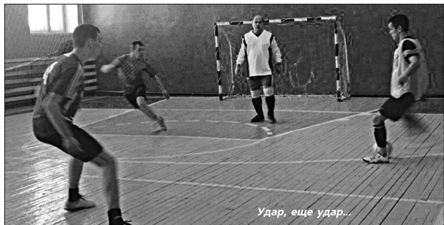
Удар, еще удар...

24 ЯНВАРЯ в рамках ежегодной проводимой акции "Студенческий десант" руководством межмуниципального отдела МВД России "Кушвинский", совместно с Общественным советом при отделе был организован и проведен дружеский матч по мини-футболу со студентами Баранчинского электромеханического техникума.