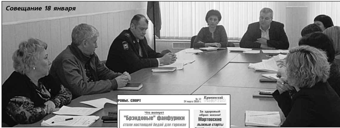
Совещание 18 января

Реализация этилового спирта должна осуществляться в соответствии с Федеральным законом №171-