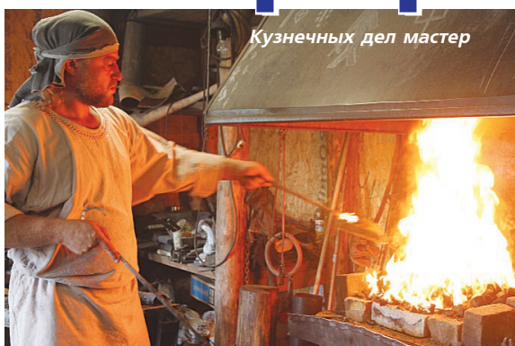
Кузнечных дел мастер