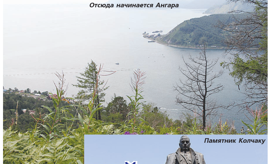
Отсюда начинается Ангара