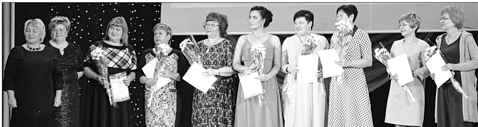
95 лет Государственной санитарно-эпидемиологической службе