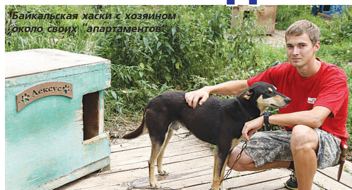
Байкальская хаски с хозяином около своих "апартаментов"