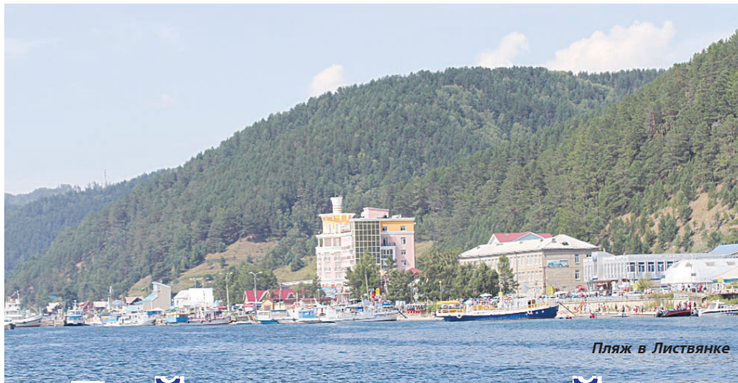
Пляж в Листвянке