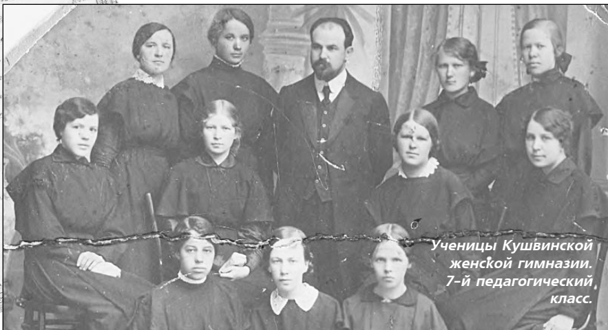
Ученицы Кушвинской женской гимназии. 7-й педагогический класс.