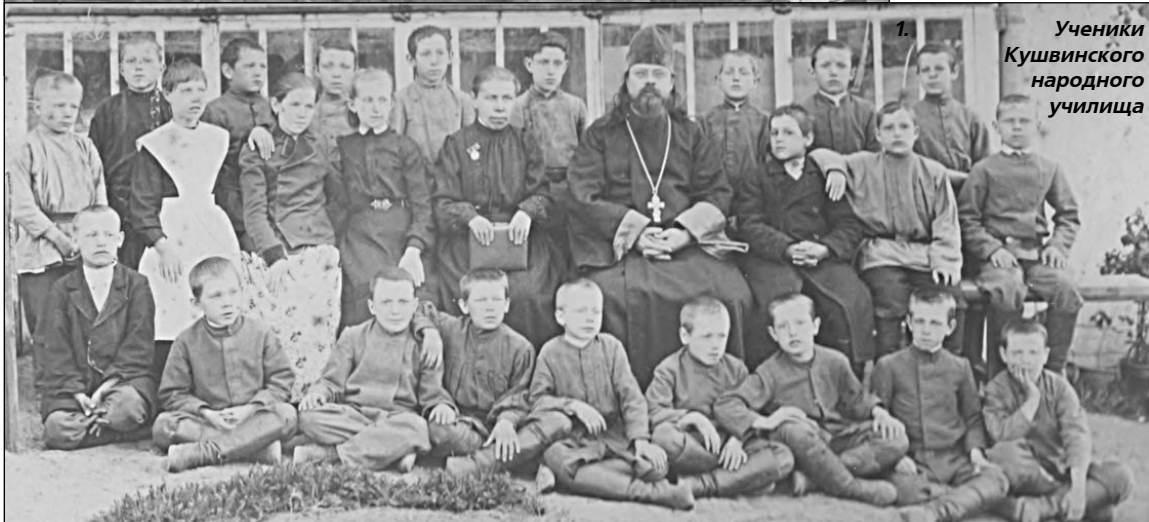
Ученики Кушвинского народного училища

человек. Обучали детей грамматике, письмоводительству, арифметике, рисованию, пению и музыке.