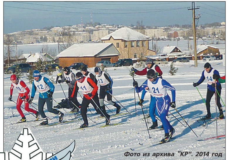
2014 год

Приглашаем жителей и гостей нашего города принять участие в борьбе за специальные призы "Лыжни России" в номинациях: "Самый старший спортсмен" (мужчина и женщина), "Самый юный участник" (мальчик и девочка), "Самая спортивная семья", "Самая массовая команда". Участники соревнований ждут памятные сувениры.