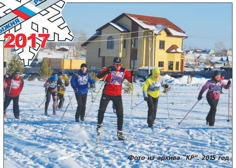
2015 год