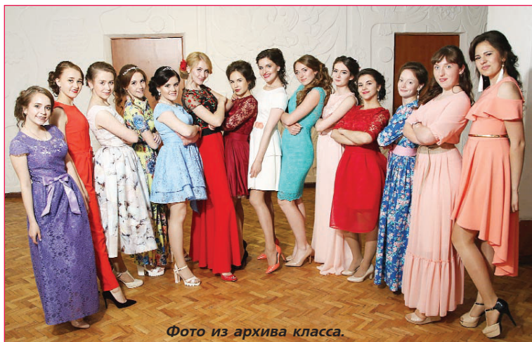
Фото из архива класса.