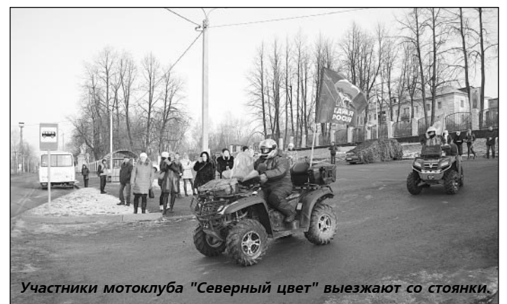
Участники мотоклуба "Северный цвет" выезжают со стоянки.