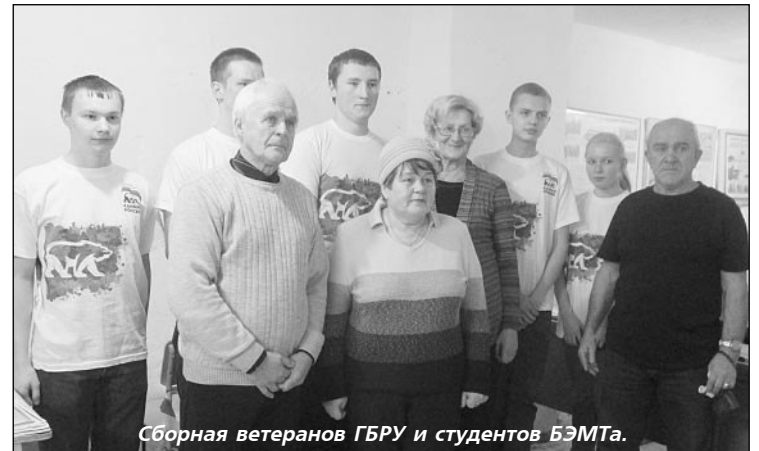
Сборная ветеранов ГБУ и студентов БЭМТа.