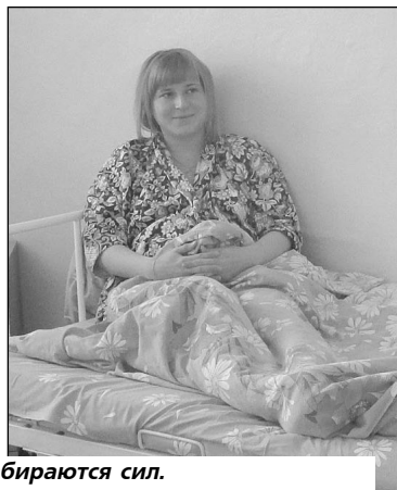
В ожидании чуда - рождения малыша мамочки набираются сил.