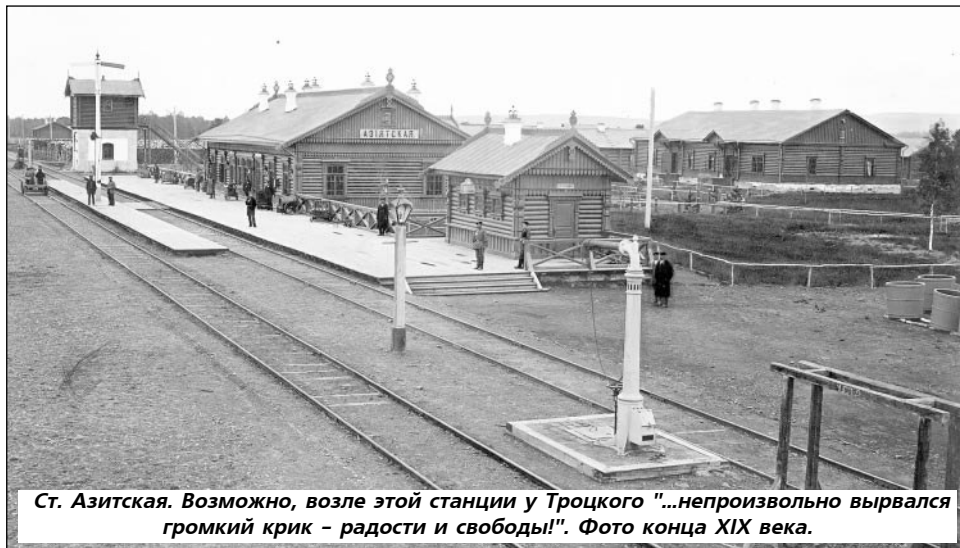
Ст. Азитская. Возможно, возле этой станции у Троцкого "...непроизвольно вырвался громкий крик - радости и свободы!". Фото конца XIX века.

ске он сделал пересадку на ширококолейную Богословскую железную дорогу. Дорога была частная, принадлежала акционерному обществу, начала строиться от станции Кушва до Надеждинска (ныне Серова) в 1903 году, а за полгода до описываемых событий, 1 сентября 1906 года на ней открылось "правильное" движе-