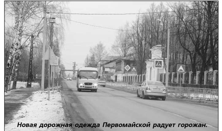
Новая дорожная одежда Первомайской радует горожан.

-ВСЕ объекты выполнены, и сейчас самое главное, как дороги покажут себя в эксплуатации. Хочу отметить, что у дорог теперь уже есть гарантийный срок: подрядные организации не просто сдали объект, но и в дальнейшем будут обеспечивать гарантии, предусмотренные государственным контрактом. Поэтому первая