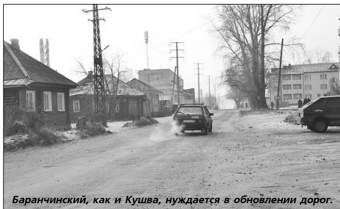
Баранчинский, как и Кушва, нуждается в обновлении дорог.