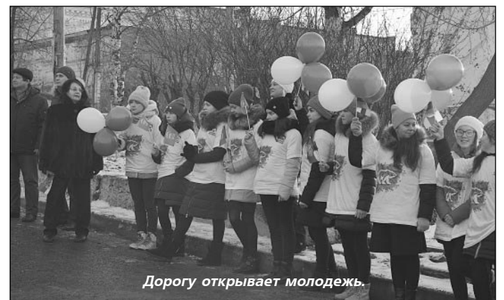
Дорогу открывает молодежь.