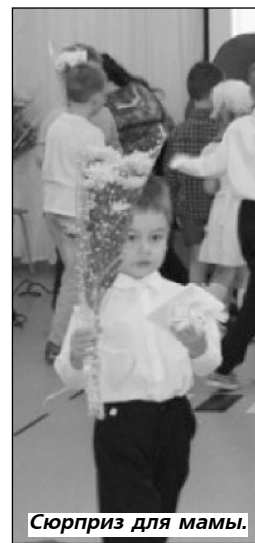
Сюрприз для мамы.

С каждым выступлением волна доброты набирала силу и была более высока, когда зазвучала мелодия песни о маме "главное слово, первое слово," - дружно запел хор девочек и мальчиков! И настал очень приятный момент- "обнимашки" и вручение мамочкам и бабушкам корзиночек из живых цветов! Эти чудные композиции дети создали совместно на мастер-классе вместе с флористами магазина "Март".