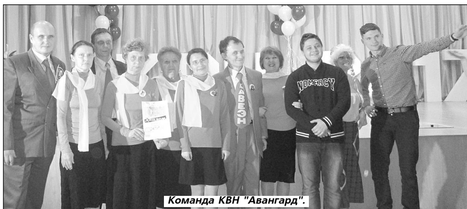
Команда КВН "Авангард".