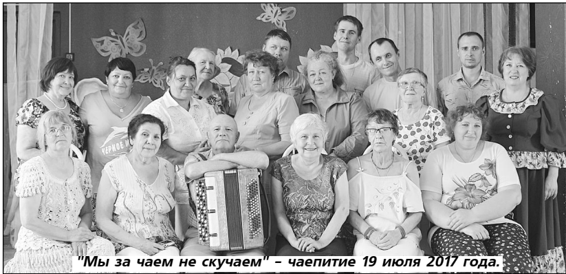
"Мы за чаем не скушаем" - чаепитие 19 июля 2017 года.

ВЕРНО говорят: "От сумы да от тюрьмы не зарекайся". Сюда бы следовало добавить: "И от инвалидности". Никто из нас не застрахован от этой беды - ДТП, болезни, разные жизненные обстоятельства, даже лишняя хромосома могут стать причиной инвалидности. Сегодня каждый десятый житель страны имеет такой социальный статус. Поэтому, пока в силах, пока можем - будем помнить, что рядом с нами есть люди, которым нужна помощь. И не только в декаду инвалидов. Хотя декада - это повод для большого и серьезного разговора о том, что может сделать общество для адаптации тех, кто по рождению или в силу обстоятельств имеет ограниченные возможности здоровья.