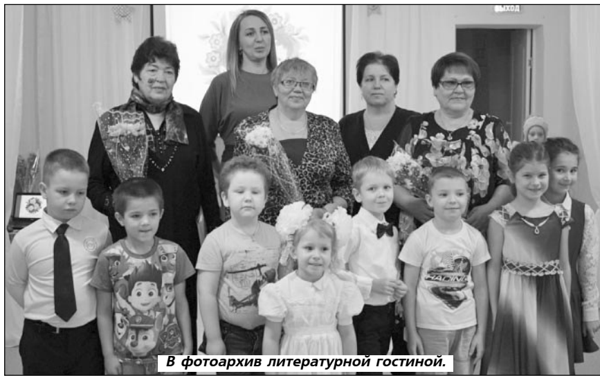
В фотоархив литературной гостиной.