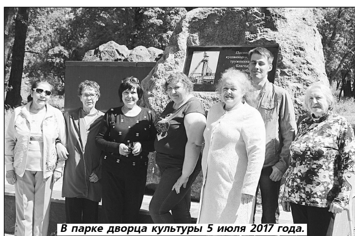
В парке дворца культуры 5 июля 2017 года.

СДЕЛАНО немало. 15 марта 2017 года - день образования клуба общения людей с ограниченными возможностями здоровья "Преодоление". Руководителем клуба является Татьяна Быкова. Сейчас в клубе состоят 60 человек.