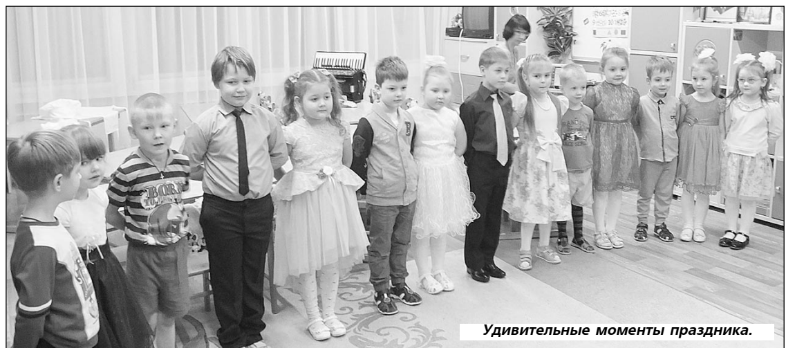
Удивительные моменты праздника.