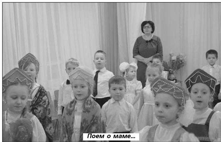
Поем о маме...