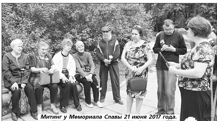
Митинг у Мемориала Славы 21 июня 2017 года.