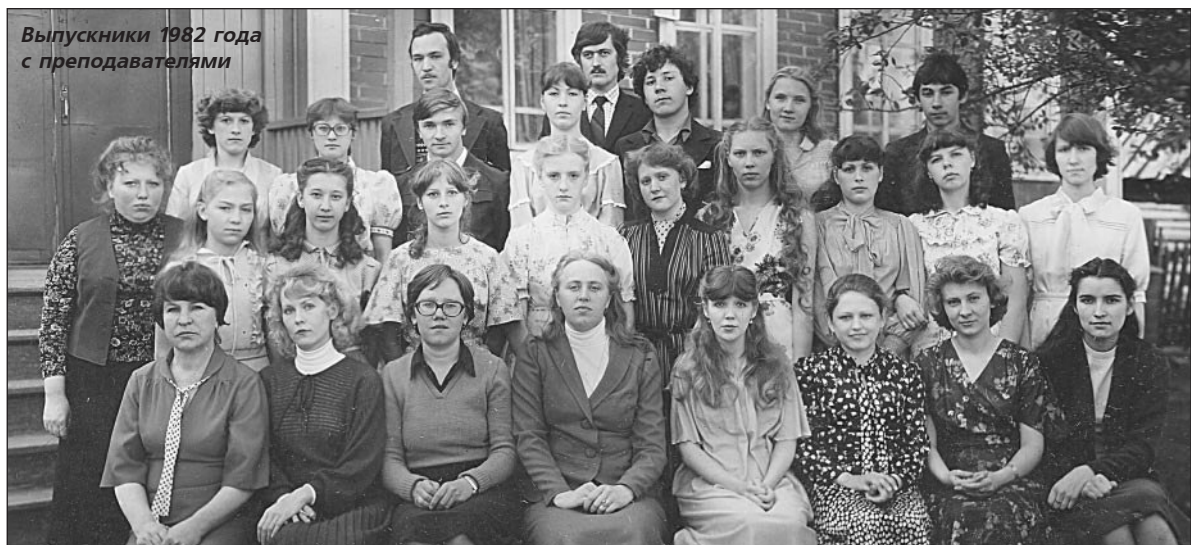
Выпускники 1982 года с преподавателями

ПРОСМАТРИВАЯ старые фотографии, невольно вспоминаешь то далекое время, когда впервые в поселке открылась музыкальная школа, и к тебе неожиданно приходит ощущение особого настроения.