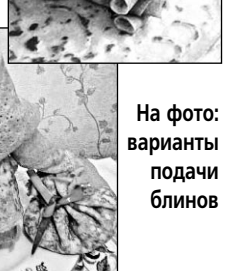
На фото: варианты подачи блинов