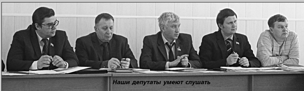
Наши депутаты умеют слушать