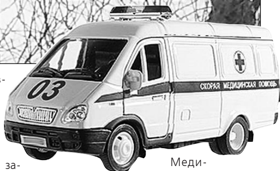
Медики приехали быстро.

Около бедолаги собрались жители микрорайона. Пытались поднять, но тщетно. Кто-то звонил в полицию, кто-то вызывал "скорую".