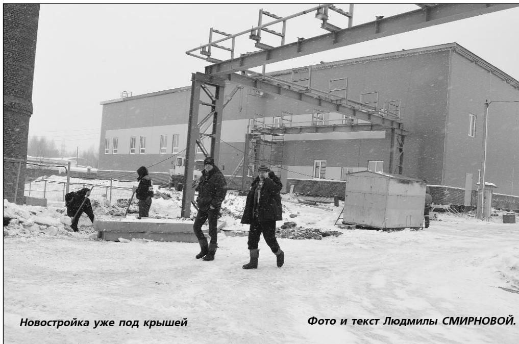
Новостройка уже под крышей

- На заводе будет установлено современное высокотехнологичное оборудование мировых брендов. Его поставят предприятия России, Швеции, Китая. По проекту в производственный комплекс войдут участок основного производства, санпропускник, лаборатория, холодильные камеры, участок тароупаковки, са-