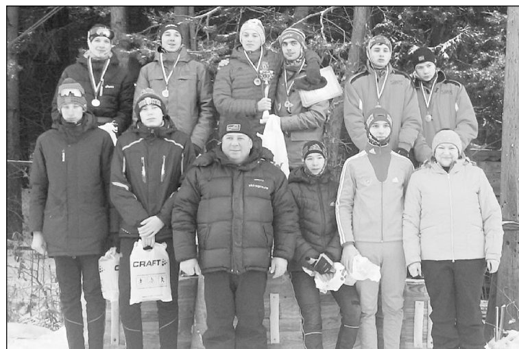
Материалы о лыжниках подготовила Любовь БУРИЧ.