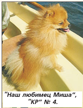
"Наш любимец Миша", "КР" № 4.