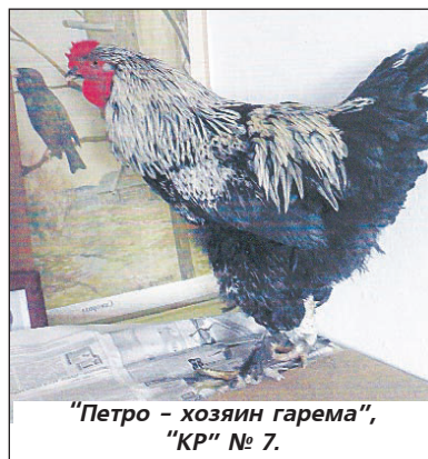
"Петро - хозяин гарема", "КР" № 7.