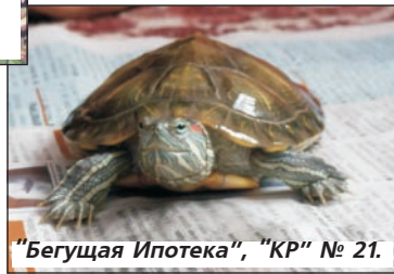
"Бегущая Ипотека", "КР" № 21.

- так завершается рассказ об увлекательном и интересном собачьем мире Лисса.