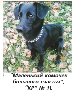
"Маленький комочек большого счастья", "КР" № 11.