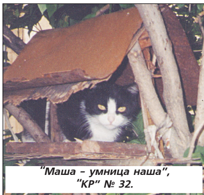
"Маша - умница наша", "КР" № 32.