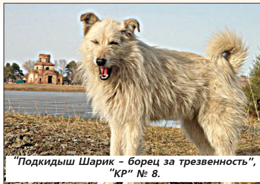
"Подкидыш Шарик - борец за трезвость", "КР" № 8.