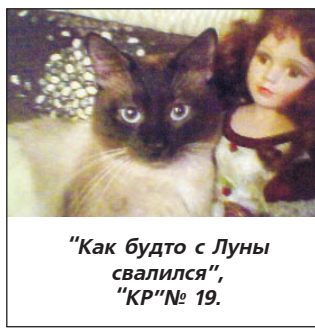
"Как будто с Луны свалился", "КР" № 19.