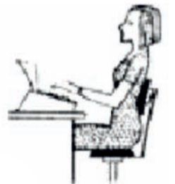
Неправильная осанка за рабочим столом