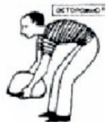
Неправильный подъем тяжестей

Правильный подъем тяжестей. Ноги согнуты, груз максимально приближен к себе.