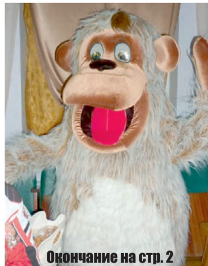
Окончание на стр. 2

Праздничный концерт «Поселок наш мы прославляем», дискотека для молодежи, красочный фейерверк, который любезно подарил поселку индивидуальный предприниматель Эдуард Максимов, – все это зрители восприняли на ура.