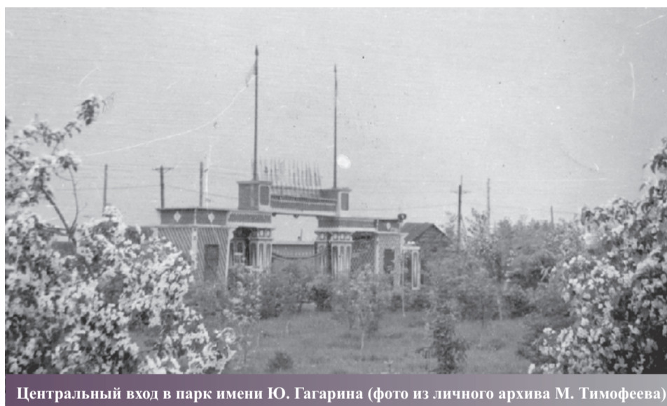
Центральный вход в парк имени Ю. Гагарина