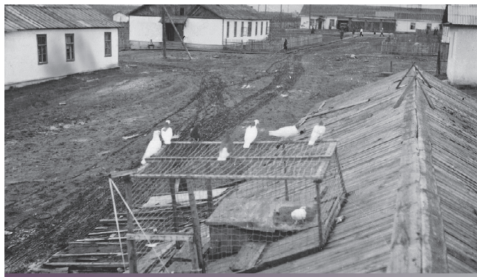
Первые бараки