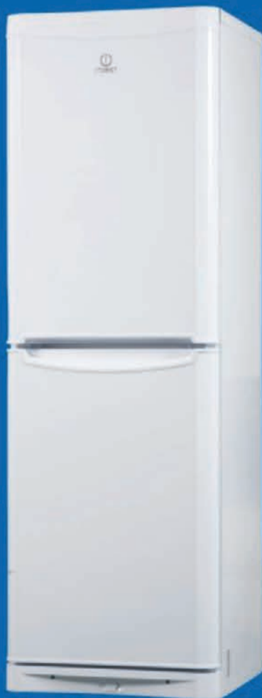
BIA 181 NF

Акция проводится с 10.09.2012 по 23.09.2012 года во всех магазинах сети. Цены указаны с учетом всех скидок. Предложение распространяется не на весь ассортимент товара. Товары сертифицированы. Кредит предоставляет ОАО «Альфа-банк», Генеральная лицензия Банка России №1326 от 29.01.1998 г. Сумма кредита: от 2000 до 150 000 рублей. Срок кредита - 2 года. Процентная ставка - 10%. Торговая организация «НОРД» компенсирует покупателю сумму процентов, подлежащих уплате Банку за весь период кредитования. Подробности акции можно узнать в магазинах и по телефону 8-800-2000-787 (звонок бесплатный).