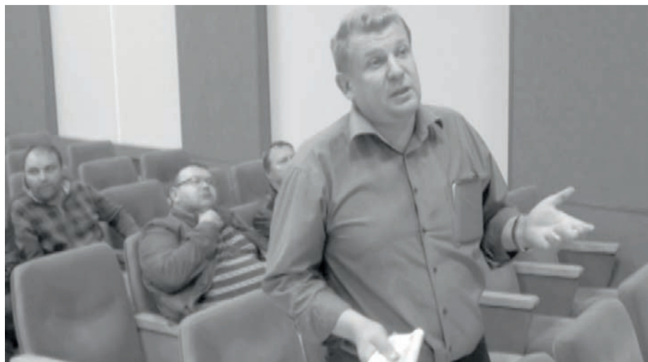
СХЕМА ТЕПЛОСНАБЖЕНИЯ ГОРОДА БУДЕТ ДОРАБОТАНА

В ходе обсуждения прозвучало замечание о том, почему в официальной печати не была опубликована эта схема, чтобы все желающие смогли с ней ознакомиться. Тогда и разговор состоялся бы в другом ключе: носил более конструктивный и обоюдопонятный характер.