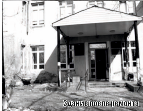
Здание после ремонта

настроение. С первыми весенними ручьями территория Управления превратилась в одну большую свалку: все, что было скрыто снежными сугробами, вытаяло – строительный мусор, траншеи после раскопок. И можно понять возмущение и негодование пенсионеров и инвалидов, которые вынуждены обращаться в Пенсионный фонд по неотложным вопросам и делам: к зданию невозможно подойти без риска травмирования.