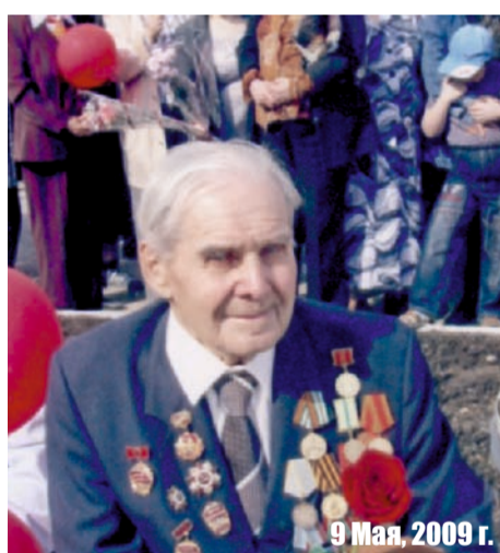
9 Мая, 2009 г.

ником железнодорожного цеха на Верхнесалдинский участок Салдинского металлургического завода. Трудовой путь, пройденный с железной дорогой, исчисляется в 40 лет.