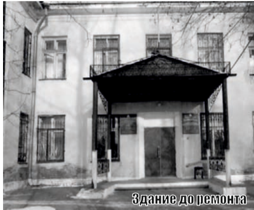
Здание до ремонта