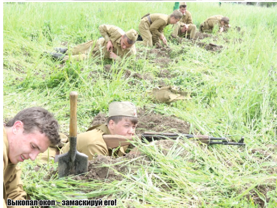
Выкопал окоп – замаскируй его!

Лузин. Примечательно то, что девушки зачастую показывали более высокие результаты, чем многие юноши.