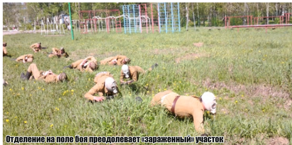
Отделение на поле боя преодолевает «зараженный» участок