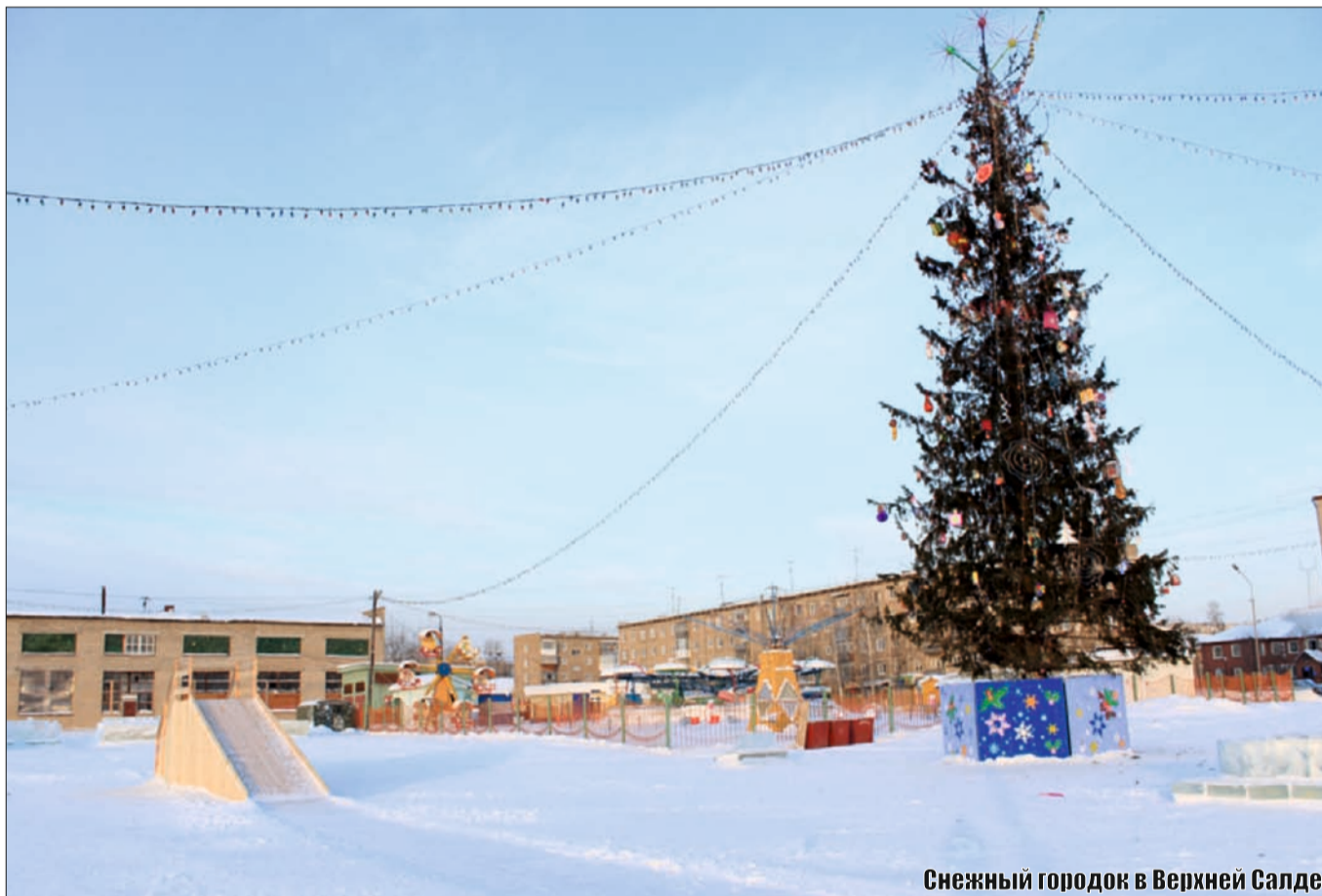
Снежный городок в Верхней Салде

Только ленивый не знает продолжения этой фразы. А оно звучит следующим образом: «так его и проведешь». Кстати, слово «проведешь» можно использовать в двух значениях: первое – это «времяпрепровождение», а второе – «обманешь». Как салдинцы, в первом смысле, провели начало 2013 года? Об этом мы спросили их после 1 января. И вот что узнали.