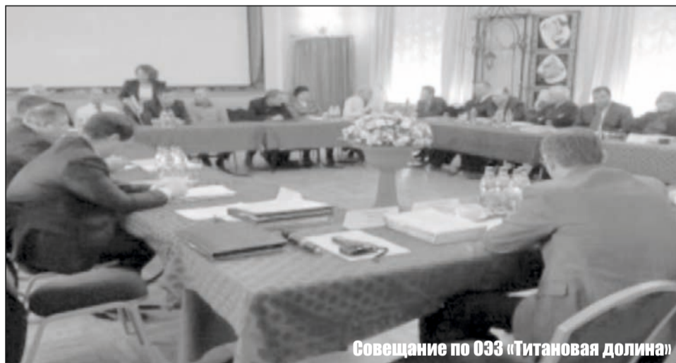
Совещание по ОЭЗ «Титановая долина»

6 декабря, в день рождения Верхней Салды, на фасаде здания типографии установили мемориальную доску,