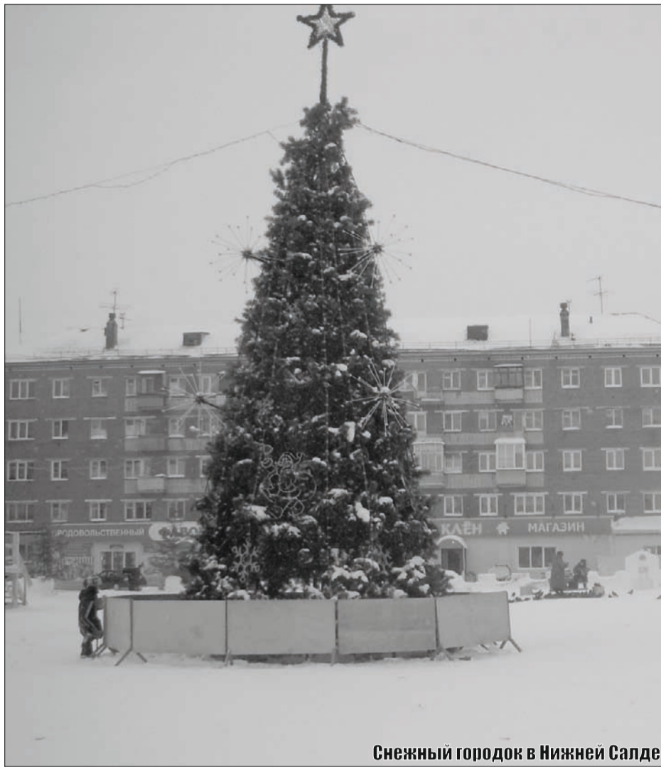
Снежный городок в Нижней Салде