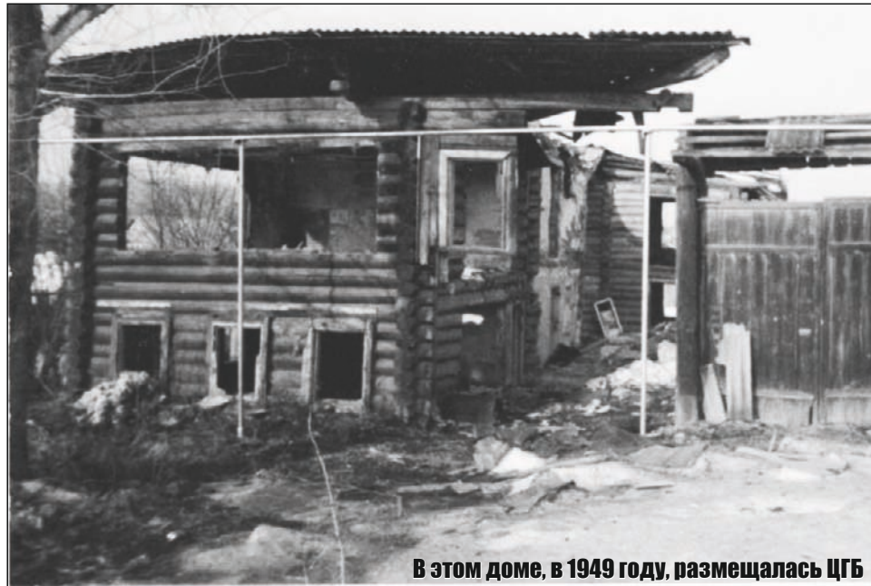
В этом доме, в 1949 году, размещалась ЦГБ

С древних времен люди создавали библиотеки, которые пользовались в народе огромным почетом и уважением. В этом году Центральная городская библиотека Верхней Салды отмечает свой 100-летний юбилей.