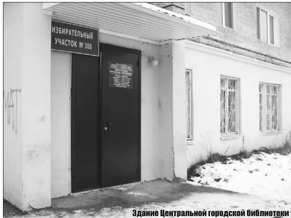
Здание Центральной городской библиотеки