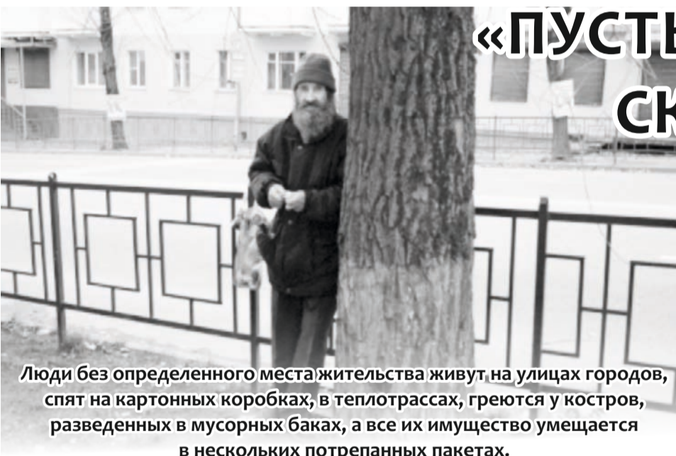
Люди без определенного места жительства живут на улицах городов, спят на картонных коробках, в теплотрассах, греются у костров, разведенных в мусорных баках, а все их имущество умещается в нескольких потрепанных пакетах.