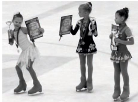
занявшей первое место.