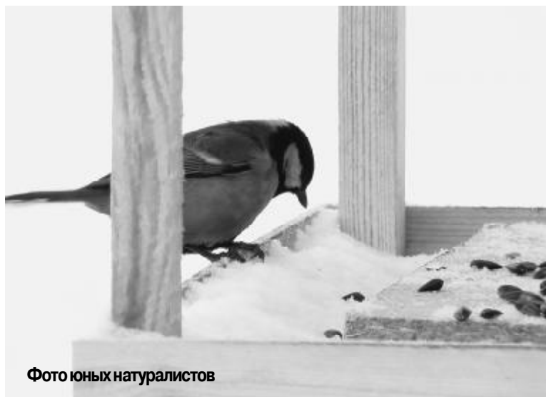
Фото юных натуралистов

брать целую фотогалерею. Портреты снегирей, синичек, свиристелей уже украшают станцию юннатов. А за окном украшает зимний денек их удивительное пение. Это стоит того, чтобы поделиться горсткой семечек и хлебных крошек. Ведь мы в ответе за тех, кого приручили.