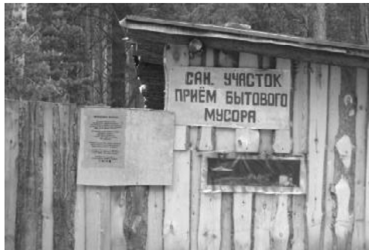
За 20 рублей у вас будут принимать мусор целый месяц