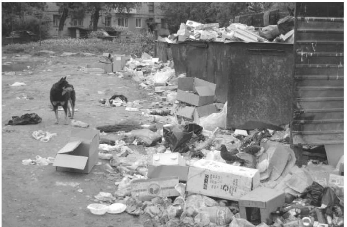
Так выглядит двор в центре Сысерти, а очищенную дорогу вновь захламляют

- Через часть района проходит Исеть, загрязненная различными стоками, ливневой канализацией