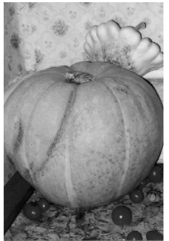
Выросла тыква большая-пребольшая. Пришлось дедушке из огорода ее на тележке везти.