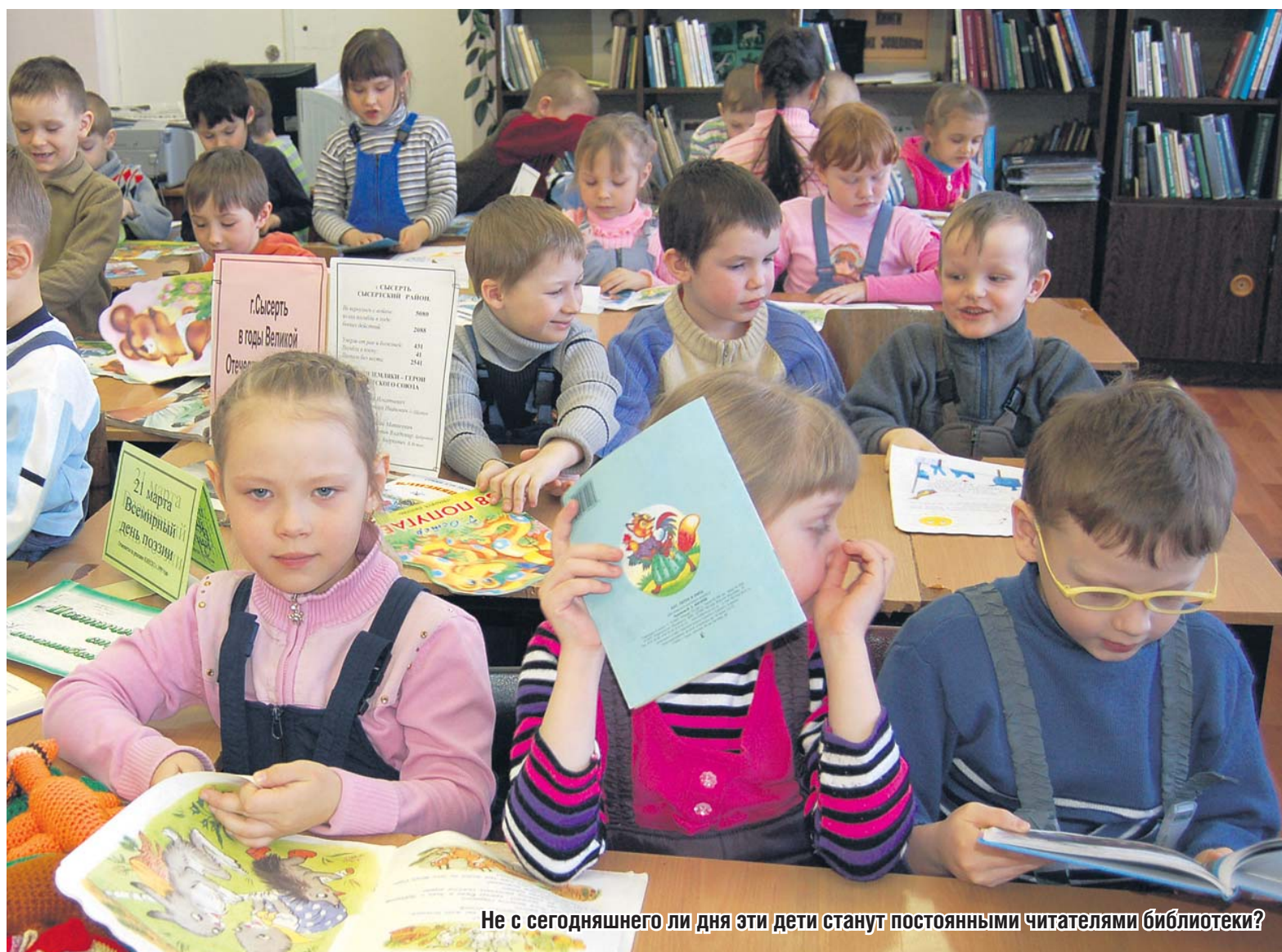
Не с сегодняшнего ли дня эти дети станут постоянными читателями библиотеки?

В библиотеке для детей и юношества в городском центре досуга предпоследняя неделя марта, когда школьники отдыхали на каникулах, была названа «Неделей книги». Каждый день был посвящен какой-либо теме.