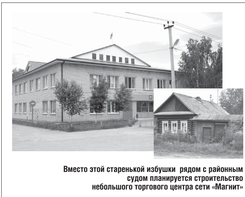
Вместо этой старенькой избушки рядом с районным судом планируется строительство небольшого торгового центра сети «Магнит»

ливу воды. Недавно это обсуждалось на публичных слушаниях. Тем более, что и сегодня «Тонус» закупает у нас этот запас воды. Только платит за нее нашему ЖКХ. В случае строительства цеха они оборудуют свою скважину и ЖКХ платить перестанут. Зато бюджет получит с них налог на землю, на имущество и на заработную плату. И при развитии