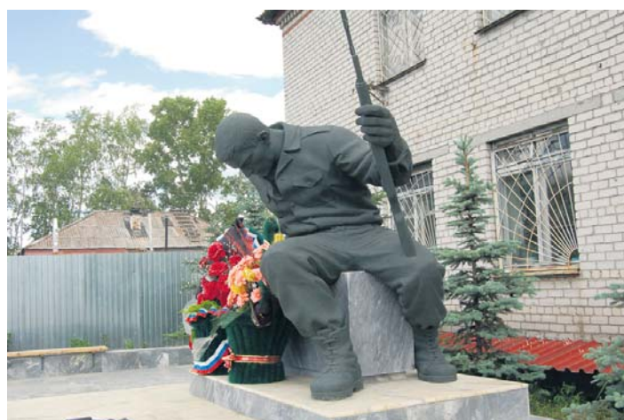
Аллея голубых елей и памятник погибшим сотрудникам украсили облик районного отдела милиции