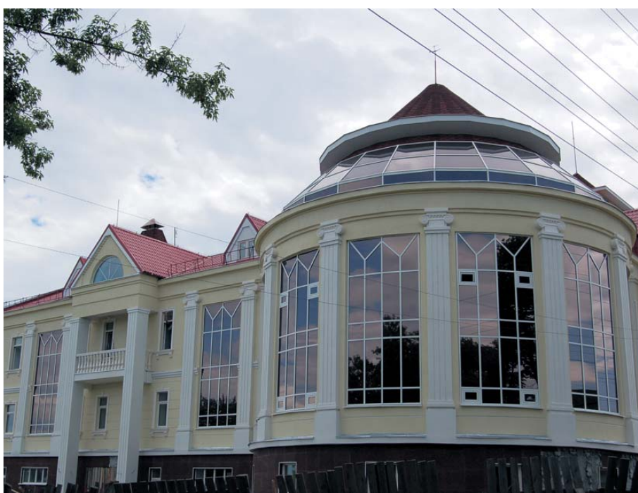
Новая гостиница украшает старый центр Сысерти