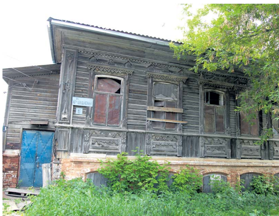
А рядом на перекрестке - по контрасту зачатое музейное здание