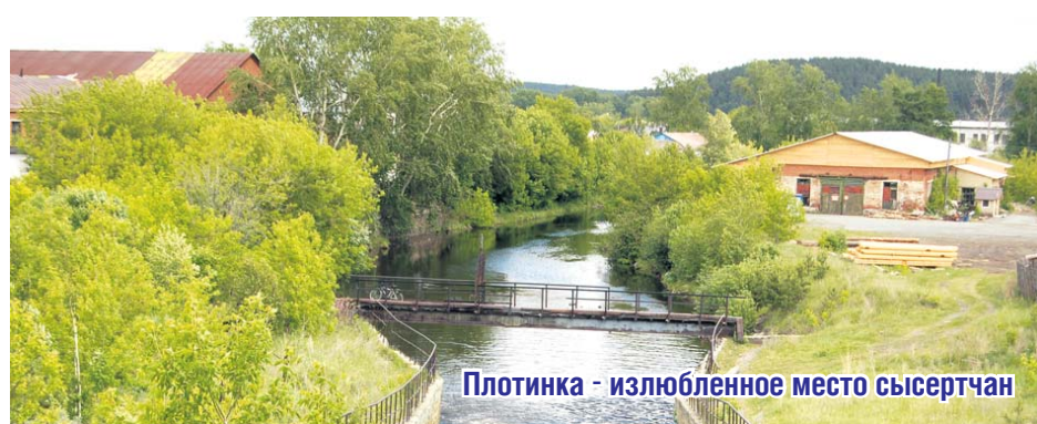
Плотинка - излюбленное место сысертчян