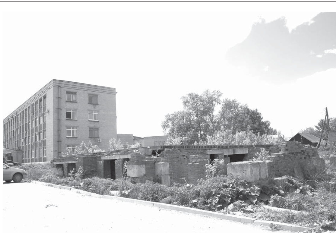
Подобные руины представляет собой разрушающийся фундамент возле администрации округа

может встать на очередь в любом муниципалитете. По этому закону по всей области очередников больше шести тысяч. Из них больше трех тысяч – хотят получить участки в Сысертском районе. Все хотят сюда. Множество людей едет к нам отдыхать. Что они оставляют после себя – рассказывать не надо.