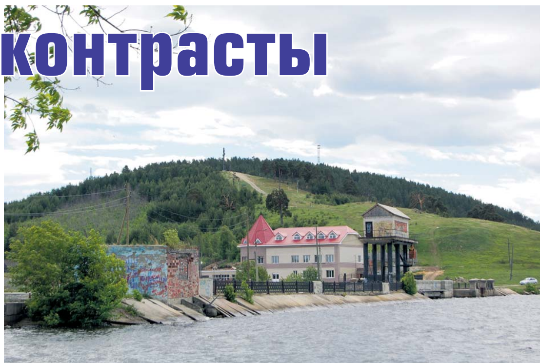
Бесеновка – вечный символ Сысерти – обрастает частными дворцами