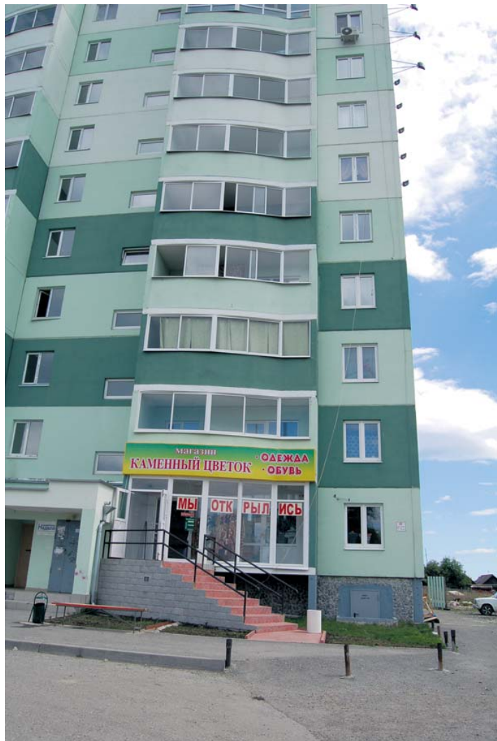
До недавнего времени самыми высокими жилыми домами были девятиэтажки в центре. Но их «переплюнул» десятиэтажный дом. Первый в новом микрорайоне – Каменный цветок