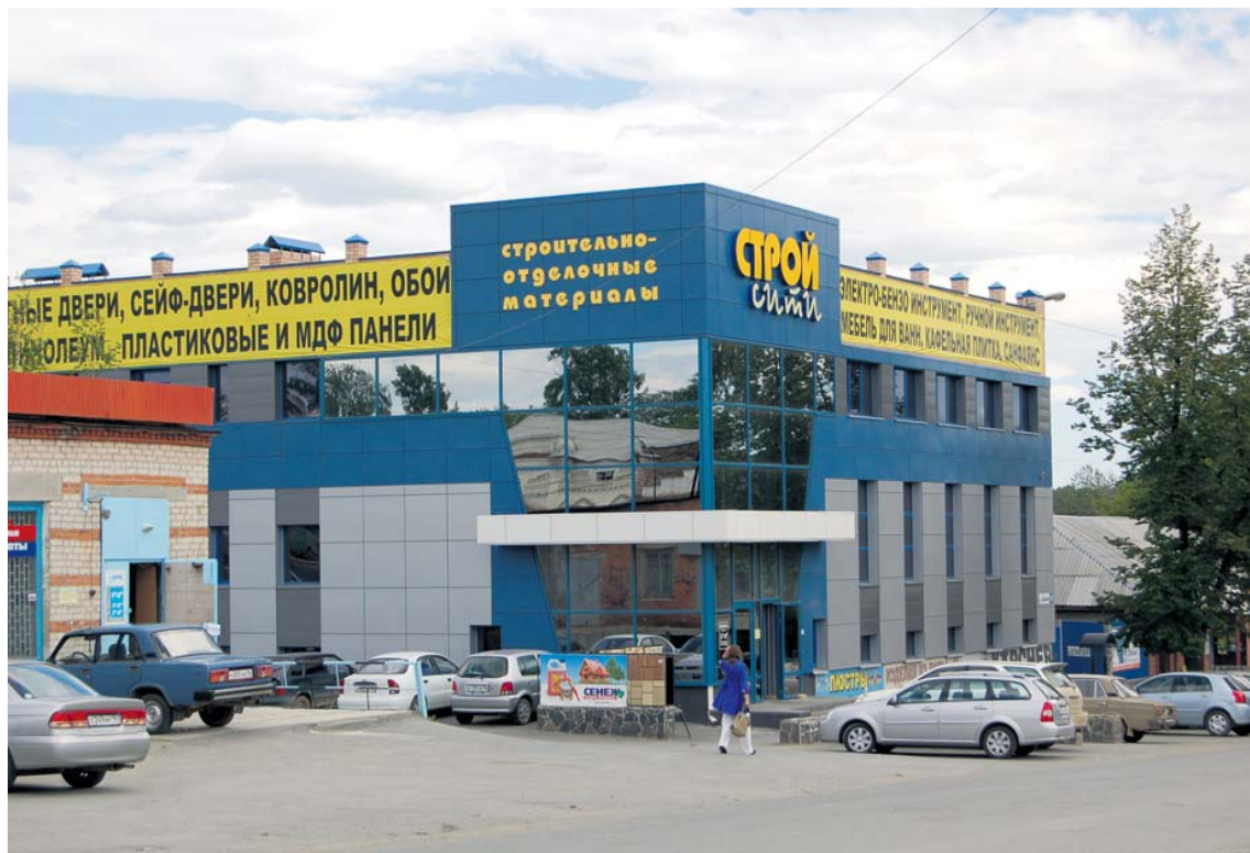
«Малахит» с годами разрастается вниз, вверх и вширь. Современные торговые центры «Светоч», «Стройсити», «Малахит», кажется, соревнуются друг с другом еще и по размеру