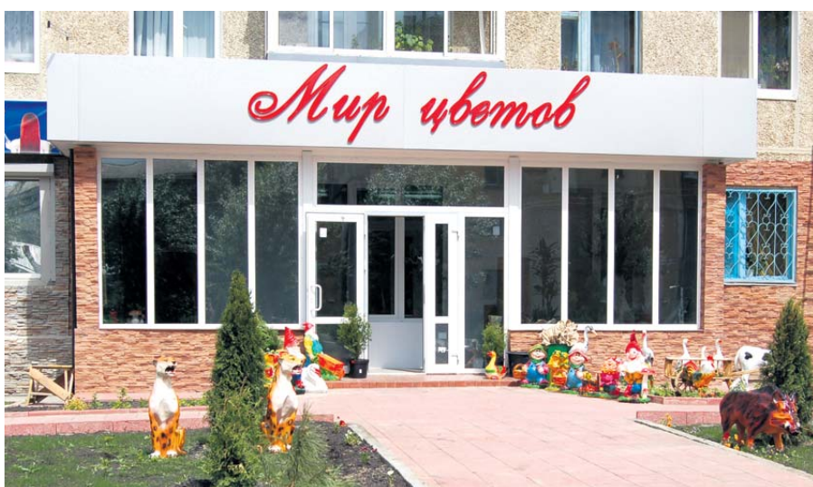
Новые магазины, переделанные из квартир первых этажей, все смелее и оживленнее оформляют полянку вокруг своей торговой точки