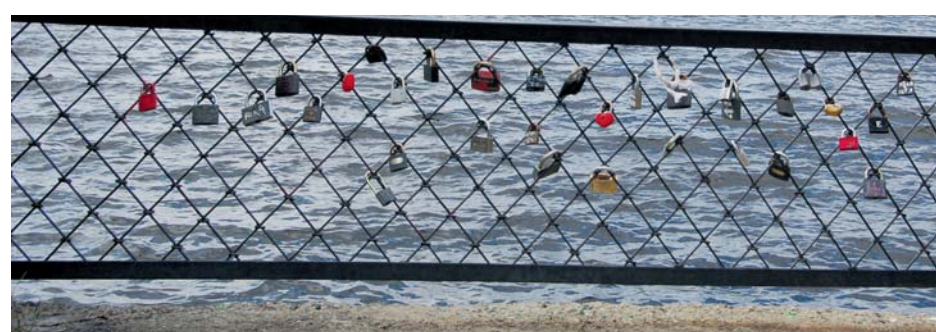
Новая традиция - молодожены скрепляют свой союз замком на плотинке