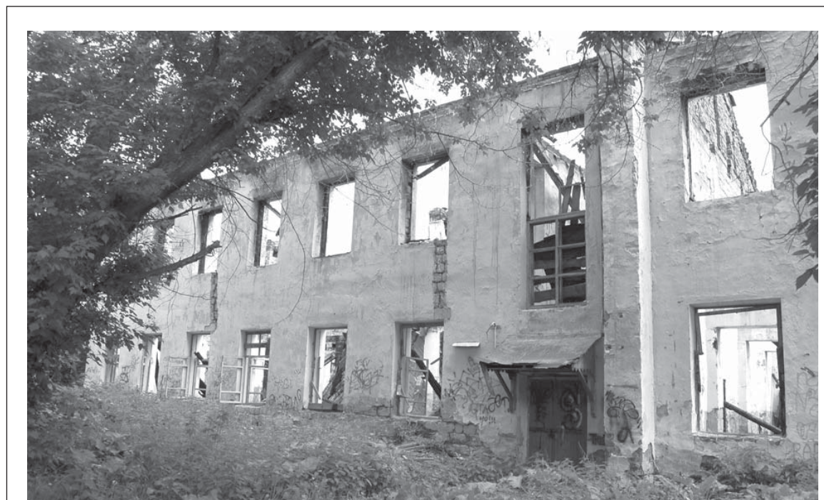
От здания школы № 14 осталось удручающее зрелище

Хотелось бы, чтобы обсуждение было более взвешенным. Чтобы не отметалось все с порога. Без изменений невозможно развитие. Чтобы идти вперед, нужно делать шаги. Если мы не хотим, чтобы экономика находилась в ситуации стагнации, мы должны стимулировать какое-то производство. Разумеется, не всякое, а только такое, которое позволило нам сохранить экологическую чистоту. Последние годы мы «живем одним днем». Не задумываясь, что же останется следующим поколениям. Какой будет Сысерть через 20-30 лет? А об этом бы тоже надо думать. Даже в ситуации нынешнего скудного бюджетного обеспечения.