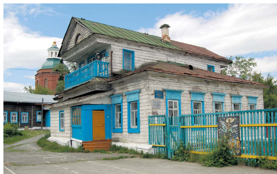
Ветхое здание - детский сад «Теремок»