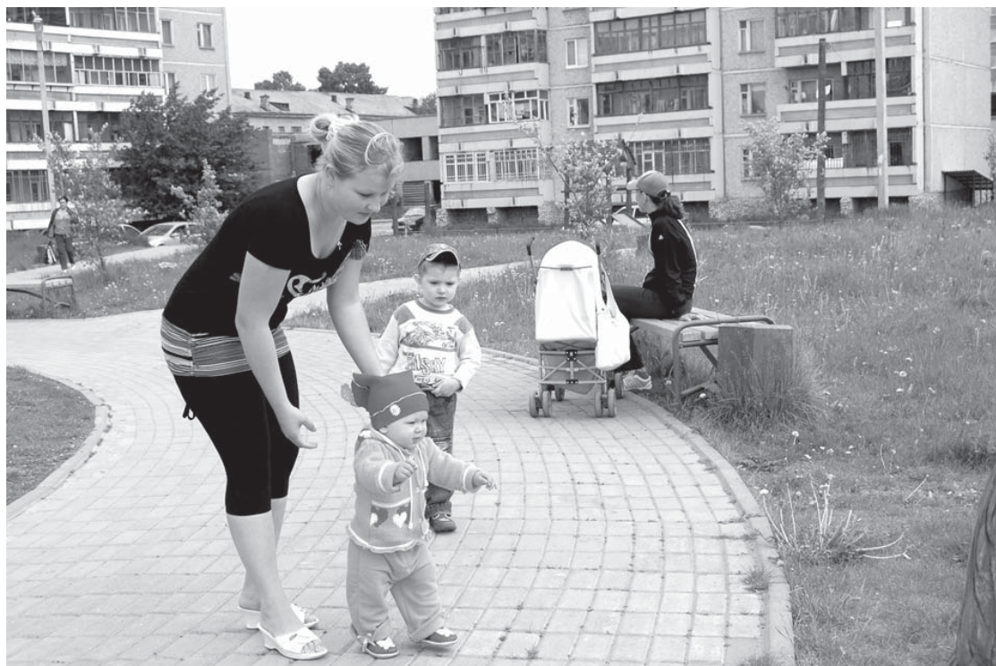
Парк во дворах девятиэтажных домов становится любимым местом для прогулок молодых мам

- Берега большинства озер находятся в ведении министерства природных ресурсов. Я бы с удовольствием отдал в аренду, если арендатор будет содержать свой участок в чистоте. Больно смотреть, во что превращаются наши берега после отдыхающих. Количество мусора стремительно увеличивается, при этом очень много примеров, когда предприниматели наводят чистоту, к удо-