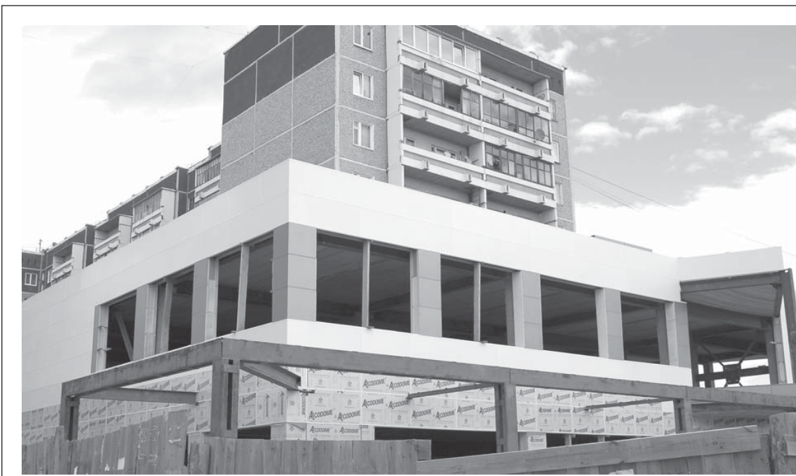
Наконец-то сдвинулся с мертвой точки долгострой в центре Сысерти. В пристрое девятиэтажного дома на перекрестке К. Либкнехта – Коммуны идет активный монтаж делового центра

- Любое производство несет загрязнение. Даже частники, малый бизнес. Но это не настолько большие выбросы, какие нам, скажем, может дать цементный завод. Вполне приемлемым предложением считаю и цех по роз-