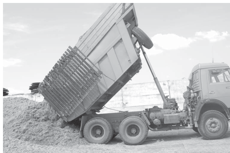
Идет закладка силосных ям в агрофирме «Патруши»