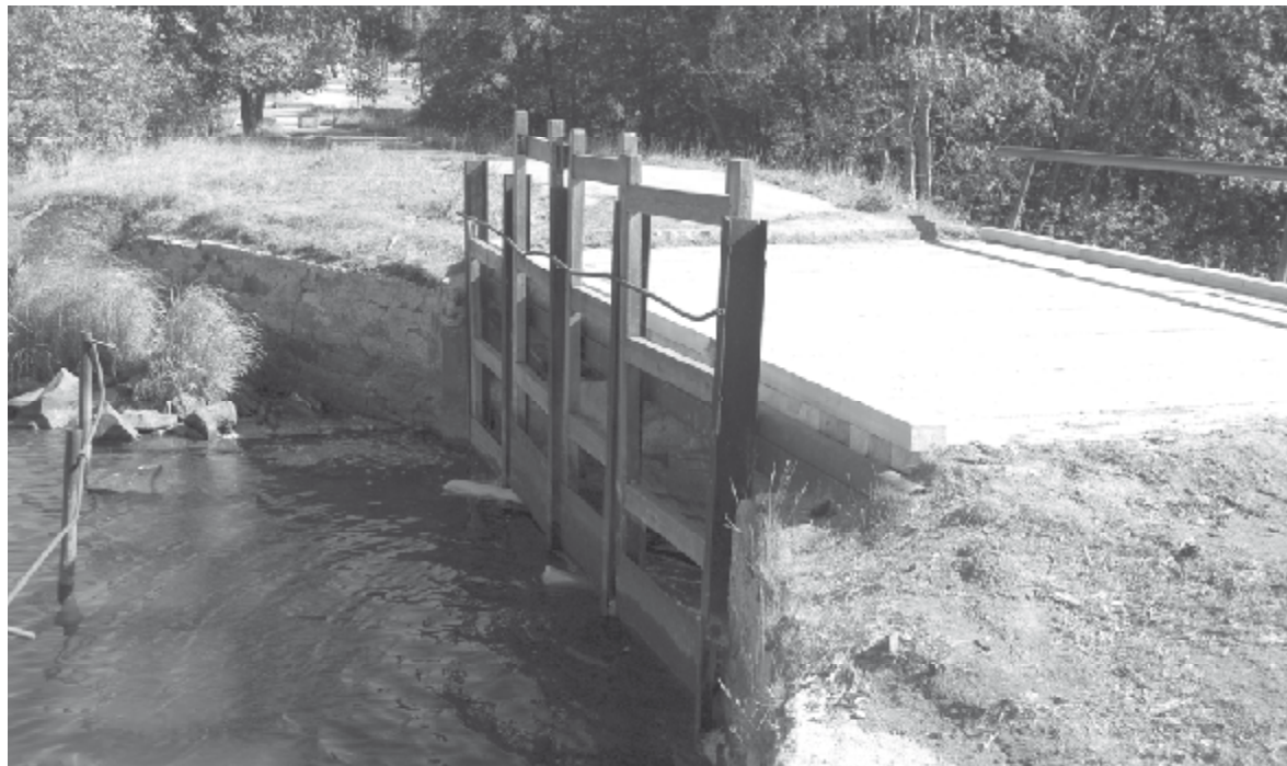
В газете «Маяк» N 61 от 26 августа было опубликовано обращение жителей поселка Каменка по поводу ремонта разрушенного настила плотины. Наконец, просьба жителей выполнена - мост отремонтирован.