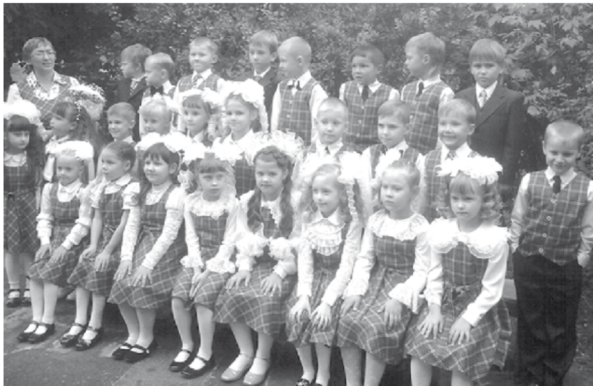
Нынче первоклассники сысертской школы N23 надели школьную форму. К примеру, 1 "Б", который вы видите на снимке, - выбрал серую клетчатую ткань. Из нее у мальчиков сшиты жилетки, а у девочек - сарафаны. Сразу видно - что это один классный коллектив. У каждого класса - форма своя. Смотрится куда интересней, чем когда все одеты вразнобой!