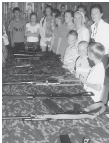
На снимках: во время летней смены.