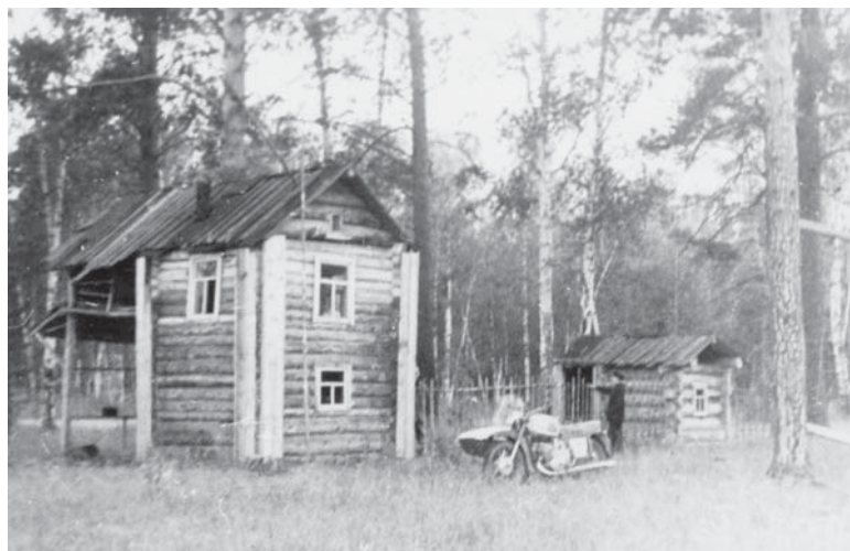
г. Сысерть.